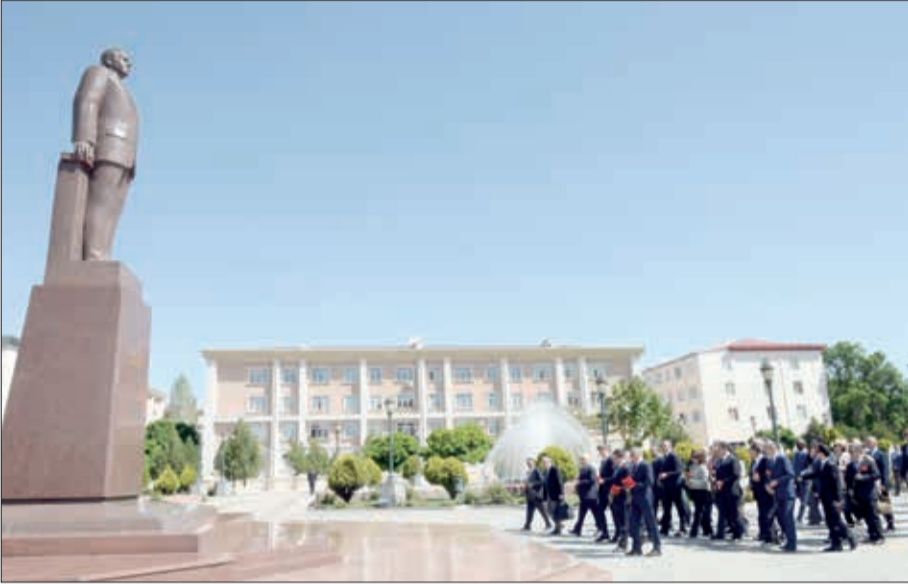
Xalqımızın böyük oğlu, dahi rəhbər, dünya şöhrətli siyasətçi Heydər Əliyevin yubileyi ilə bağlı paytaxtda və bölgələrdə, ölkənin müəssisə və təşkilatlarında tədbirlər davam etdirilir.