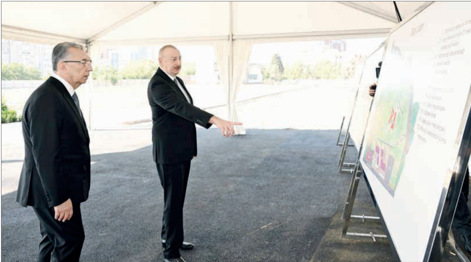
Azərbaycan Respublikasının Prezidenti İlham Əliyev Bakıda "Gənclik" metrosu yanında yaradılan yeni parkda işlərin gedişi ilə tanış olub.

Prezident İlham Əliyev "Gənclik" metrosu yanında yaradılan yeni parkda işlərin gedişi ilə tanış olub