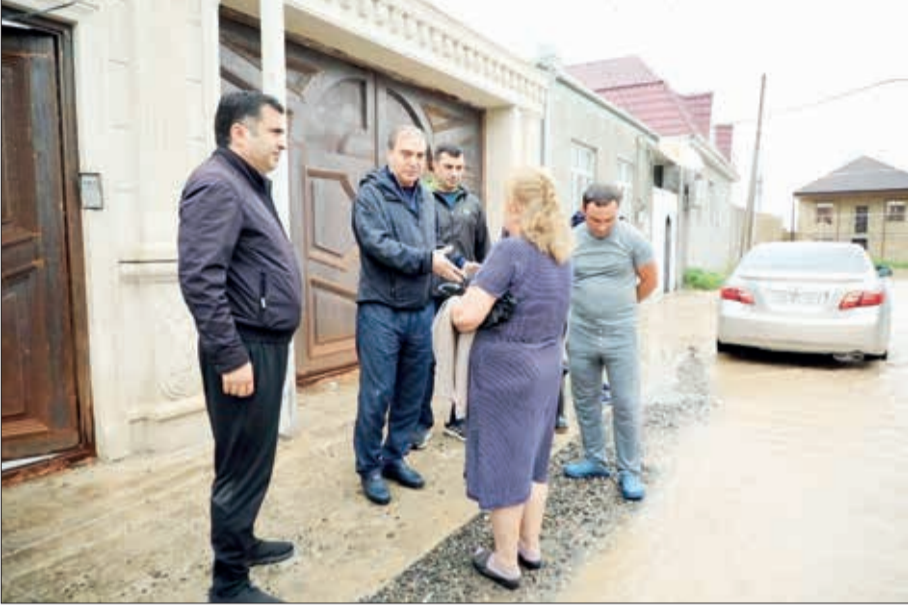
Son 2 gündə leysan xarakterli yağışların yağması nəticəsində ölkəmizin bir sıra rayonlarında, o cümlədən Gəncə şəhərində daşqınlar baş vermiş, təsərrüfatlara, evlərə, həyatı sahələrə ciddi ziyan dəymişdir.

Yerlərdə yaranan fəsadları aradan qaldırmağa çalışırlar