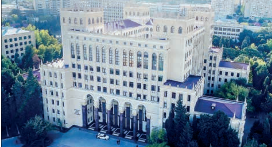
(əvvəlki ötən sayımızda)

Beləliklə, II məqalənin son tezisində məzmununda iki aspekt sıx qarşılıqlı əlaqədə ifadə edilmişdir. Birinci aspekt hər bir AMEA əməkdaşının araşdırma sərbəstliyi ilə alim məsuliyyətinin nisbətini ölkənin strateji inkişaf kursunun ruhuna uyğun müəyyən etməsi ilə əlaqəlidir.