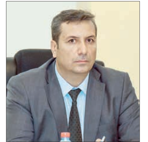
Müstəqil ƏLƏSGƏRLİ, XQ-nin media eksperti

Diqqətlə yanaşanda bəlli olur ki, ABŞ-nin siyasətinə boyun əyməyən, müstəqil davranan və qədar ölkə varsa, hamısının adını toplayıb hesabətini “demokratik azadlıqlar olmayan ölkələr” kategoriyasında göstəriblər. Bu övlətlər “bütün azadlıq indeksləri üzrə pis tendensiyaların yaradıcıları” kimi təqdim edilir. Danılmaz faktıdır ki, həmin övlətlər ABŞ-nin strateji planlarında hədəf se-