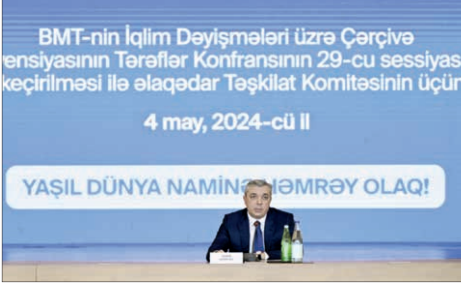
Mayın 4-də BMT-nin İqlim Dəyişmələri üzrə Çərçivə Konvensiyasının Tərəflər Konfransının 29-cu sessiyasının (COP29) keçirilməsi ilə əlaqədar Təşkilat Komitəsinin üçüncü iclası olub.

Beynəlxalq məclisə hazırlıq məsələləri geniş müzakirə olunub