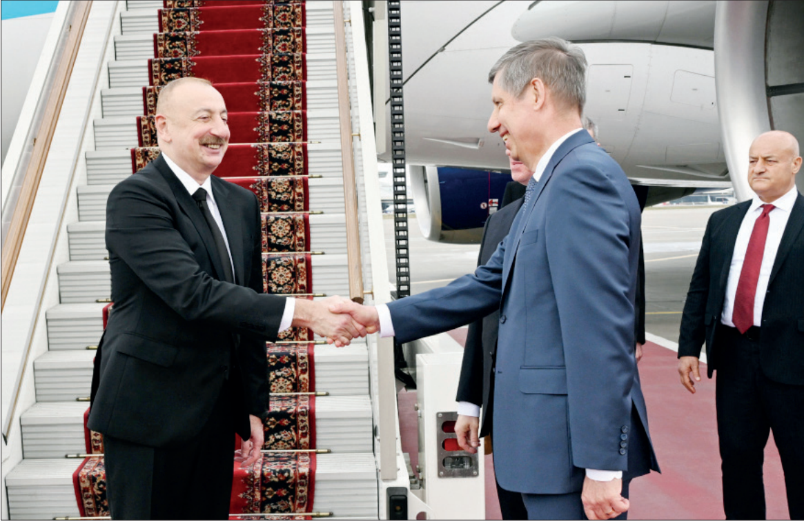
Azərbaycan Respublikasının Prezidenti İlham Əliyev Rusiya Federasiyasının Prezidenti Vladimir Putinin dəvəti ilə aprelin 22-də Moskvağa işgüzar səfərə gəlib.

Moskvanın Vnukovo-2 beynəlxalq hava limanında dövlətimizin başçısını Rusiya xarici işlər na-