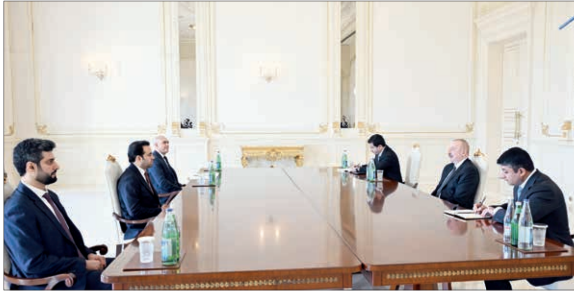
Azərbaycan Respublikasının Prezidenti İlham Əliyev aprelin 2-də Müsəlman Ağsaqqalları Şurasının Baş katibi Məhəmməd Əbdülsalamı qəbul edib.

Azərbaycanın İslam həmrəyliyi gücləndirilməsi istiqamətində böyük səylər göstərdiyini qeyd edən dövlətimizin başçısı 2020-ci ildə işğaldan azad edilmiş Şuşa şəhərinin "İslam dünyasının mədəniyyət paytaxtı" elan olunduğunu xatırlayaraq bu qərarın bütün İslam dünyasının Azərbaycana göstərdiyi böyük dəstəyini təzə-hürü olduğunu bildirdi və gələcək ay Şuşada tentənəli tədbirlərin keçiriləcəyini məmnunluqla vurğuladı.