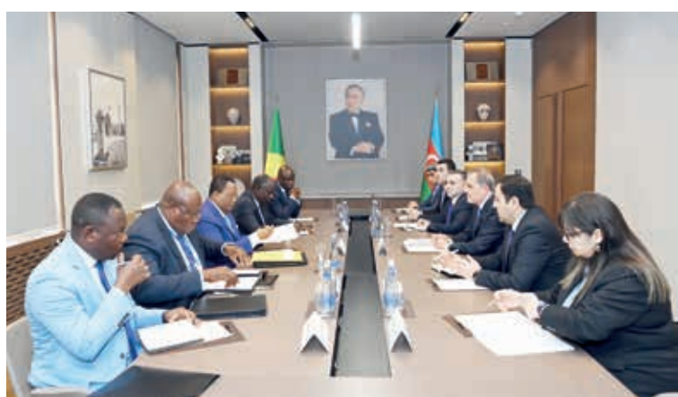
Aprelin 2-də xarici işlər naziri Ceyhun Bayramov ölkəmizə səfəri çərçivəsində Konqo Respublikasının xarici işlər və əməkdaşlıq naziri Jan-Klod Qakossonun rəhbərlik etdiyi nümayəndə heyəti ilə görüşüb.

Ceyhun Bayramov və Jan-Klod Qakosson arasında təkbətək görüş daha sonra hər iki tərəfin nümayəndə heyətlərinin iştirakı ilə geniş tərkibdə davam edib.