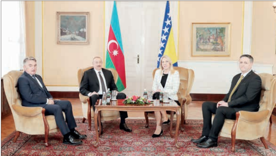
Aprelin 13-də Sarayevoda Azərbaycan Respublikasının Prezidenti İlham Əliyevin Bosniya və Herseqovinanın Rəyasət Heyətinin Sədri xanım Jelka Tsvijanović, Rəyasət Heyətinin üzvləri Jelko Komşiç və Denis Beçiroviç ilə görüşü olub. Əvvəlcə rəsmi foto çəkdirildi.