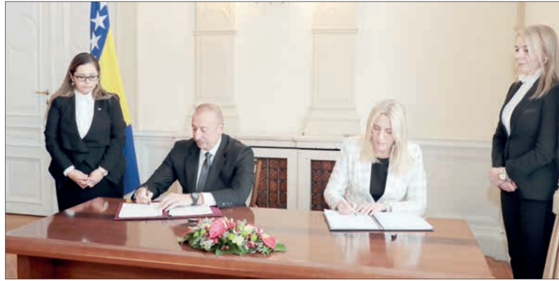
Aprelin 13-də Sarayevoda "Azərbaycan Respublikası ilə Bosniya və Herseqovina arasında strateji tərəfdaşlıq haqqında Birgə Bəyannamə" imzalanıb.

Sənədi Azərbaycan Respublikasının Prezidenti İlham Əliyev və Bosniya və Herseqovinanın Rəyasət Heyətinin Sədri xanım Jelka Tsvijanović imzaladılar.