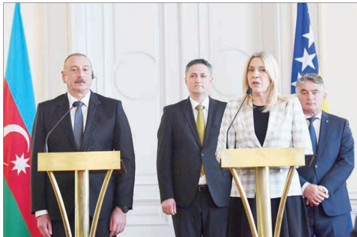
Azərbaycan Prezidenti İlham Əliyev və Bosniya və Herseqovinanın Rəyasət Heyətinin Sədri xanım Jelka Tsvijanović aprelin 13-də Sarayevoda mətbuata bəyanatlarla çıxış ediblər. Əvvəlcə Bosniya və Herseqovinanın Rəyasət Heyətinin Sədri bəyanatla çıxış etdi.