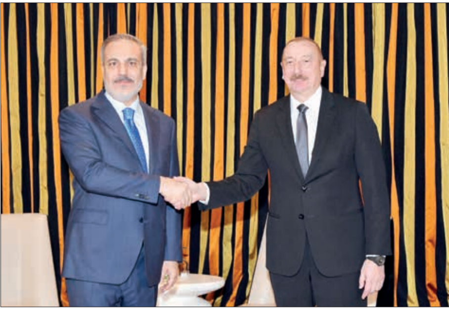
Fevralın 16-da Münxendə Azərbaycan Respublikasının Prezidenti İlham Əliyev ilə qarşı tərəfin müzakirə etdiyi görüşün əsasında Azərbaycan Respublikasının xarici işlər naziri Hakan Fidanın görüşü olub.