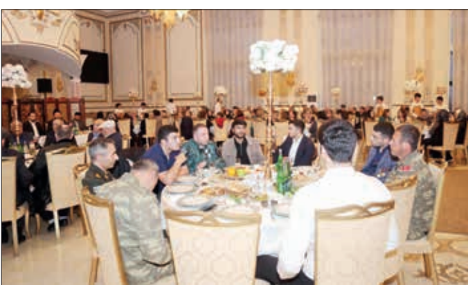
Heydər Əliyev Fondunun prezidenti Mehriban Əliyevanın təşəbbüsü ilə aprelin 11-də Xəzər rayonunda iftar süfrəsi açılıb.

Tədbirdə “Qurani-Kərim”dən ayələr oxunub, Azərbaycanın müstəqilliyi və ərazi bütövlüyü uğrunda şəhid olan Vətən övladlarının əziz ruhuna dualar edilib, Ramazan ayının fəzilətlərindən və savablarından danışılıb.