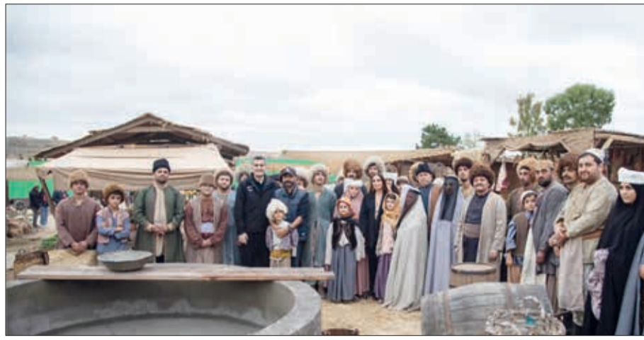
Bakı Media Mərkəzinin istehsalı olan çoxseriyalı "Himayədar" filminin çəkilişləri yekunlaşıb.

Ekran əsəri Hacı Zeynalabdin Tağıyev vətəninin 100-ci ildönümü ilə əlaqədar çəkilib. Xeyriyyəçiyə həsr olunan filmde XIX əsrin sonu – XX əsrin əvvəlində Bakıda və bölgədə baş verən mühüm tarixi hadisələr əks etdirilir.