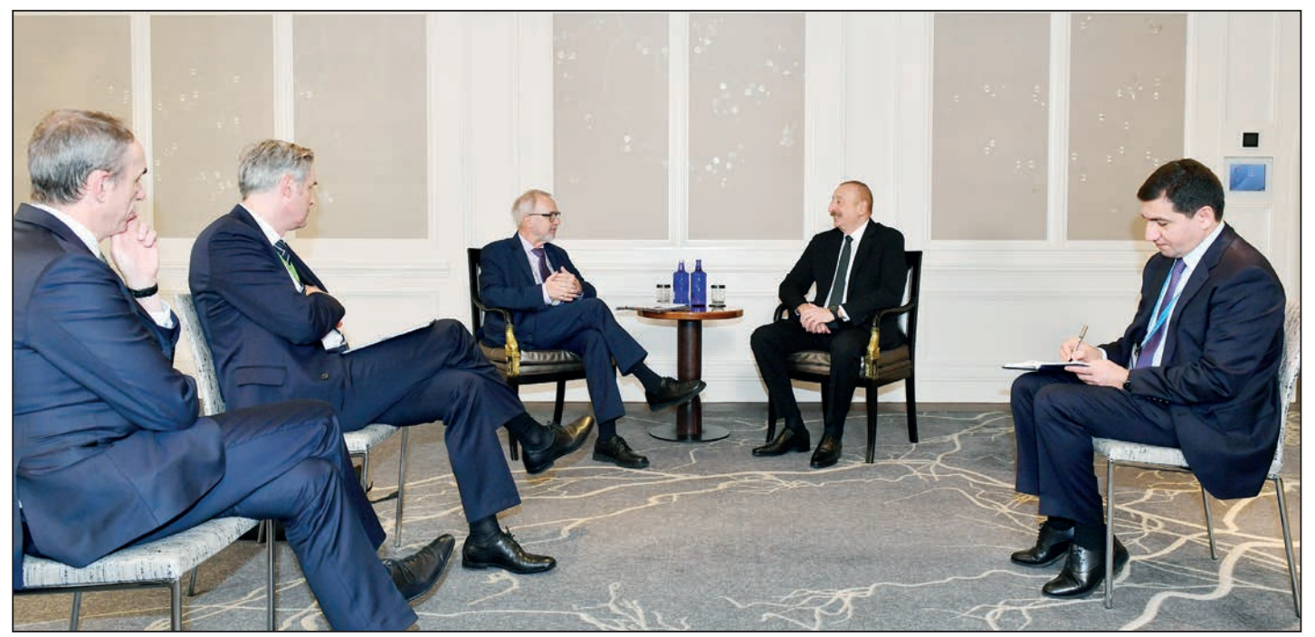
Azərbaycan Respublikasının Prezidenti İlham Əliyev fevralın 18-də Münxendə Avropa İnvestisiya Bankının (EİB) prezidenti Verner Hoyer ilə görüşüb.

AZƏRTAC xəbər verir ki, dövlətimizin başçısı Avropa İnvestisiya Bankı ilə Azərbaycan arasında əməkdaşlıqdan məmnunluğunu ifadə etdi, ölkəmizin Avropa İttifaqı ilə çox sıx əlaqələrinin olduğunu bildirdi.