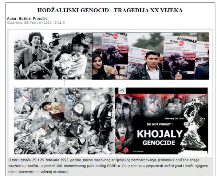
HODZALJSKI GENOCID - TRAGEDIJA XX VIEKA Autor: Bolşar Protodit Çap tarixi: 20. fevral 2021. 16:02:11

qının haqlı intiqam savaşı erməniliyə buvaxtədək ibrətli dərslər versə də, sürü psixologiyalı toplumu yenidən quduşlandırmaq tapılır. Bu, dünyanın elə məkrli mərkəzlərində ki, Xocalı amansızlığını onlar həmin gecə uzaqdan dərindən nəfəs kəsmədən, yatmadan