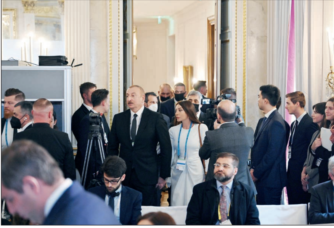
(əvvəlki 2-ci səhifədə)

Azərbaycan uzun illər ərzində müasir daşımalar və logistika infrastrukturunun yaradılmasına yatırımlar edib. İndi isə Mərkəzi Asiyadan daşınan yüklərin Azərbaycan vasitəsilə Avropaya yöndəlməsi əlavə imkanlar açır. Lakin bildiyiniz kimi, bizim öz müharibəmiz olub. 44 gün çəkmiş müharibə iki ildən bir az çox əvvəl baş vermişdir. Biz müharibənin nə olduğunu bilirik. Onun xalqlar üçün nə dərəcədə dağınıqlar və əziyyətlər gətirdiyini bilirik. Buna görə, biz təbii ki, istəyirik Avrasiyada sülh bərqərar olunsun. Hesab edirik ki, Azərbaycan və Ermənistan uzun müddət çəkmiş toqquşmadan uzaqlaşmanı nümayiş etdirməli, qarşılıqlı ədavət və düşmənçiliyə son qoymalıdır. Hazırda biz Ermənistan ilə Azərbaycan arasında sülh sazişi üzərində çalışırıq. Ümid edirik ki, biz bu işi gec yox, tezliklə tamamlayacağıq. Düşünürəm ki, bu, ciddi tarixi fikir ayrılığına malik olan ölkələrin bir araya gəlməsi və düşmənçilik səhifəsinin bağlanması yaxşı nümunə ola bilər. Mənim cavabım belədir.