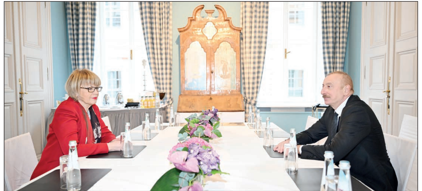
Fevralın 18-də Münxendə Azərbaycan Respublikasının Prezidenti İlham Əliyevin ATƏT-in Baş katibi xanım