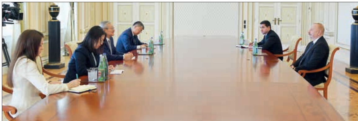
Fevralın 8-də Azərbaycan Respublikasının Prezidenti İlham Əliyev Şanxay Əməkdaşlıq Təşkilatının Baş katibi Can Mini qəbul edib.

Prezident İlham Əliyev müşahidə missiyasında iştirakına görə Şanxay Əməkdaşlıq Təşkilatının Baş katibinə, müşahidə qrupunun üzvlərinə və üzv dövlətlərə minnətdarlığını bildirdi.