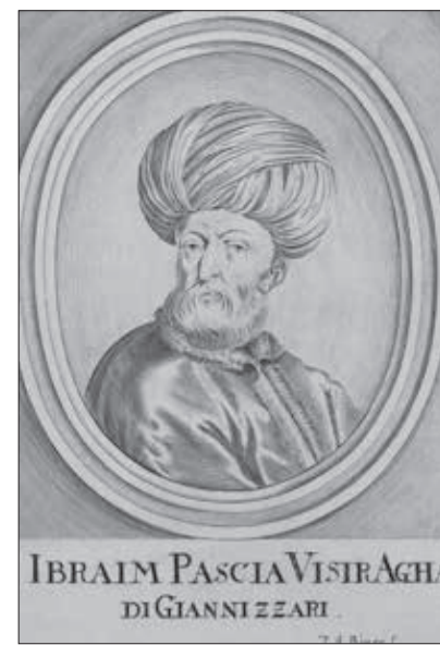
IBRAHİM PAŞA VİSTR AĞHA DI GIANNI ZZARI

sarayına qayıtmaq istəyir, lakin Sultan onun öz sarayında gecələməsinə istəyir. Vəzir itaətkarçasına saraydakı otaqlardan birinə keçir və uzanıb yatır. Elə ki, Parçalının yuxuya getdiyini deyirlər, Sultan cəlladları çağırtdırır. On-