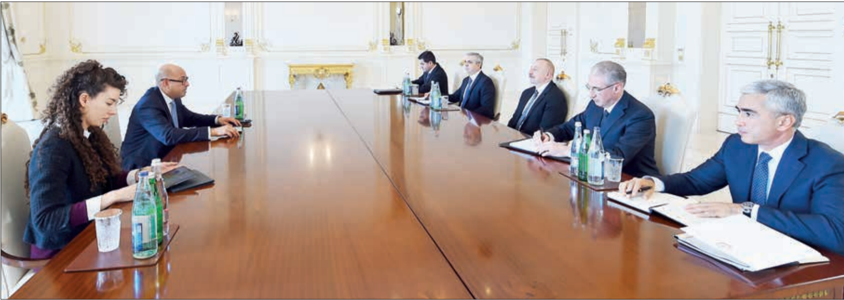
Azərbaycan Respublikasının Prezidenti İlham Əliyev fevralın 2-də BMT-nin İqlim Dəyişmələri üzrə Çərçivə Konvensiyasının icraçı katibi Saymon Stili qəbul edib.

Prezident İlham Əliyev BMT-nin İqlim Dəyişmələri üzrə Çərçivə Konvensiyasının icraçı katibini qəbul edib