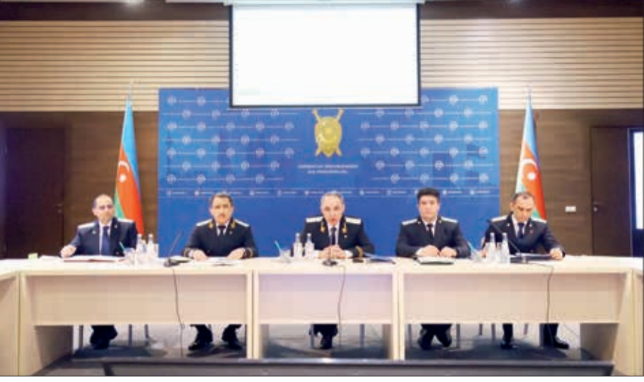
Yanvarın 19-da Baş Prokuror yanında Korruptsiyaya qarşı Mübarizə Baş İdarəsində 2023-cü ilin yekunlarına dair geniş əməliyyat müşavirəsi keçirilib.

Baş prokuror Kamran Əliyev 2023-cü ilin "Heydər Əliyev İli" elan edilməsi, dahi liderin hüquq sisteminin təkmilləşdirilməsi, habelə inkişafı istiqamətində gördüyü işlər, prokurorluq orqanlarının inkişafına verdiyi töhfələrdən danışıb.