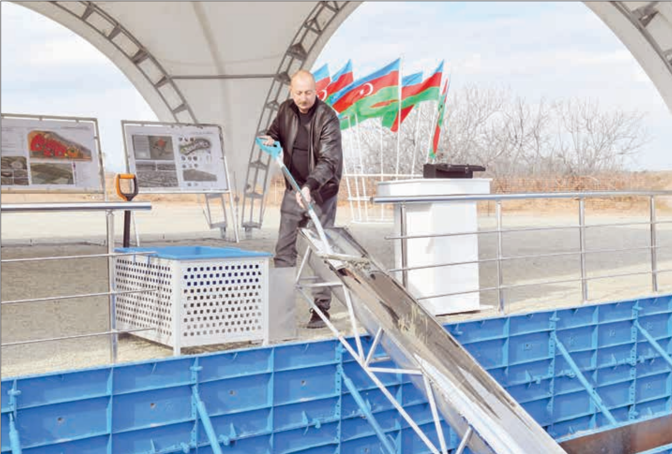
Azərbaycan Respublikasının Prezidenti İlham Əliyev Ağdam rayonunun Baş Qərvənd kəndinin təməlqoyma mərasimində iştirak edib.

Dövlətimizin başçısına kənddə görüləcək işlər barədə məlumat verildi.