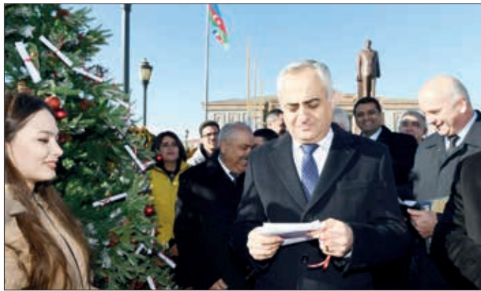
Düənə Naxçıvan şəhərində Yeni ilin gəlişi münasibətillə “Qış festivalı” açılıb.

İki günlük proqram qeyd olunan məkanlardan əlavə Heydər Əliyev Muzeyini, “Əlincaqala” tarixi abidəsini, “Qeysəriyyə” binasını və Ordubad Cümə məscidi də daxil olmaqla Naxçıvan, Culfa və Ordubad şəhərlərində olan əsas tarixi məkanları əhatə edir.