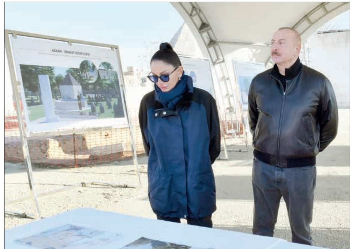
Azərbaycan Respublikasının Prezidenti İlham Əliyev və Birinci xanım Mehriban Əliyeva Ağdam şəhərində "İmarət" Kompleksində aparılan təmir-bərpa işləri ilə tanış olublar.

Dövlətimizin başçısına və birinci xanıma görülən işlər barədə məlumat verildi.