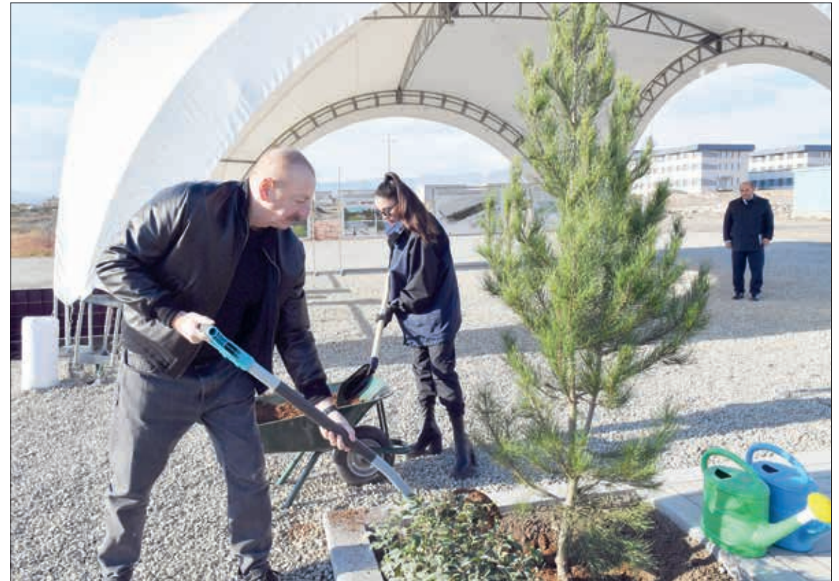
Azərbaycan Respublikasının Prezidenti İlham Əliyev və Birinci xanım Mehriban Əliyeva Ağdam şəhər Mərkəzi parkının təməlinin qoyulması mərasimində iştirak ediblər.

Dövlətimizin başçısına və birinci xanıma parkda görüləcək işlər barədə məlumat verildi.