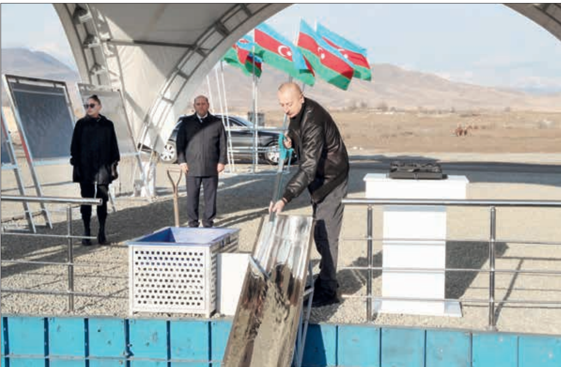
Azərbaycan Respublikasının Prezidenti İlham Əliyev və Birinci xanım Mehriban Əliyeva Ağdam şəhərində salınacaq beşinci yaşayış kompleksinin təməlinin qoyulması mərasimində iştirak ediblər.

Qarabağ iqtisadi rayonuna daxil olan işğaldan azad edilmiş ərazilərdə (Şuşa rayonu istisna olmaqla) Azərbaycan Respublikası Prezidentinin xüsusi nümayəndəsi Emin Hüseynov dövlətimizin başçısına və birinci xanıma yaşayış kompleksi barədə məlumat verdi.