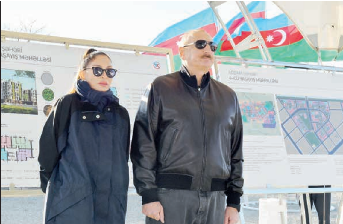
Azərbaycan Respublikasının Prezidenti İlham Əliyev və Birinci xanım Mehriban Əliyeva Ağdam şəhərində salınacaq dördüncü yaşayış kompleksinin təməlinin qoyulması mərasimində də iştirak ediblər.

Dövlətimizin başçısına və birinci xanıma yaşayış kompleksi barədə məlumat verildi.