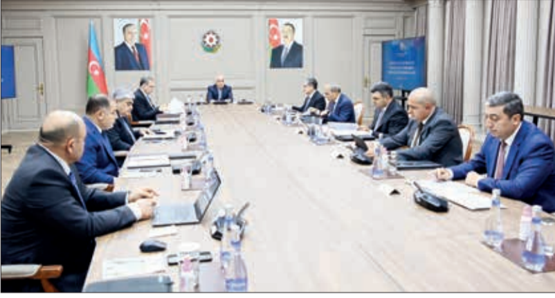
Dekabrın 8-də Azərbaycan Respublikası Dövlət Neft Fondunun (ARDNF) Müşahidə Şurasının iclası keçirilib.

Azərbaycan Respublikasının Baş naziri, ARDNF-in Müşahidə Şurasının sədri Əli Əsədovun sədrliyi ilə keçirilən iclasın gündəliyində Dövlət Neft Fondunun 2024-cü il üçün büdcə layihəsi, fondun investisiya siyasəti, investisiya portfelinin valyuta tərkibi və digər cari məsələlər ətrafı müzakirə olunub.