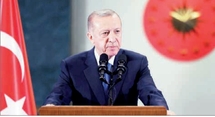
Düənə Türkiyə Prezidenti Rəcəb Təyyib Ərdoğan Yunanıstana səfər edib. O, burada Yunanıstanın Baş naziri Kiriakos Mitsotakis ilə bir çox ikitərəfli və regional mövzuları geniş müzakirə edib.

Bu, son 65 ildə Türkiyənin dövlət başçısının Afinaya ilk səfəridir