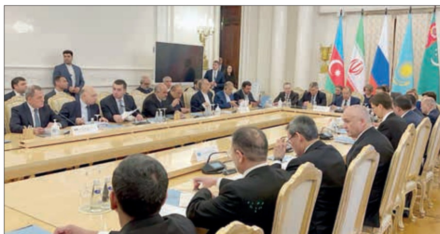
Dekabrın 5-də Moskvada Xəzəryyəni dövlətlərin xarici işlər nazirlərinin geniş tərkibdə görüşü keçirilib.

Tədbirdə çıxış edən Azərbaycanın Xarici İşlər naziri Ceyhun Bayramov belə görüşlərin keçirilməsinin Xəzər regionunda mövcud əməkdaşlıq gündəliyində duran aktual məsələlərin müzakirəsində mühüm rol oynadığını diqqətə çatdırıb.