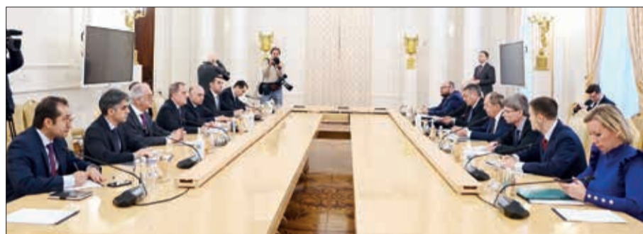
Dekabrın 5-də Moskvada Azərbaycanın Xarici İşlər naziri Ceyhun Bayramov ilə Rusiyanın Xarici İşlər naziri Sergey Lavrov arasında görüş keçirilib.

Xəzəryyəni dövlətlərin xarici işlər nazirlərinin Moskvada təşkil olunmuş görüşü çərçivəsində baş tutan danışıqlarda Azərbaycan ilə Rusiya arasında ikitərəfli və çoxtərəfli əməkdaşlıq gündəliyinin aktual məsələləri, o cümlədən, regionda mövcud vəziyyət müzakirə edilib.