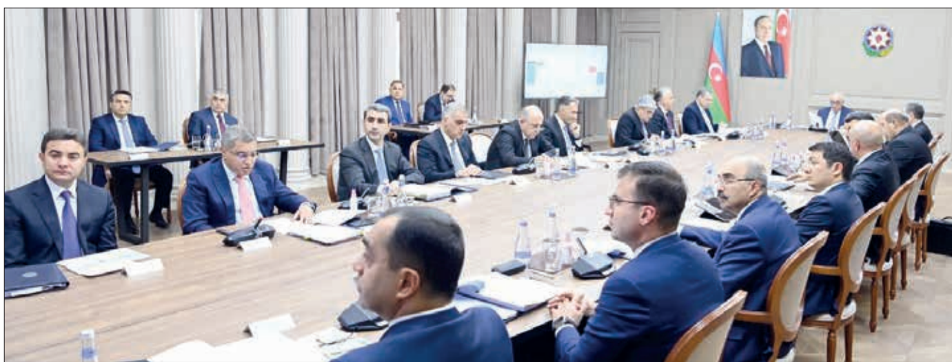
Azərbaycan Respublikasının İqtisadi Şüarasının və Azərbaycan Investisiya Holdinginin (AİH) Müşahidə Şurasının birgə iclası keçirilib.

Nazirlər Kabinetinin mətbuat xidmətindən bildirilib ki, Azərbaycan Respublikasının Baş naziri Əli Əsədovun sədrliyi ilə keçirilən birgə iclasın gündəliyində AİH-nin idarəetməsinə verilmiş Portfel şirkətlərinin 2023-cü ilin 9 ayının yekunları üzrə Fəaliyyət Hesabatı, o cümlədən maliyyə, kommersiya, investisiya və əmə-