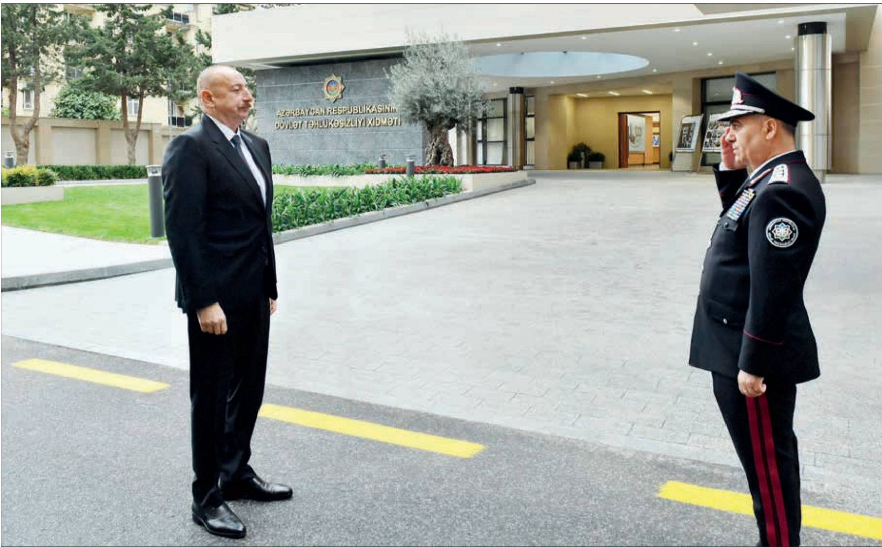
Azərbaycan Respublikasının Prezidenti İlham Əliyev Dövlət Təhlükəsizliyi Xidmətinin yeni inzibati binalarının açılışında iştirak edib.

Prezident İlham Əliyev Dövlət Təhlükəsizliyi Xidmətinin yeni inzibati binalarının açılışında iştirak edib