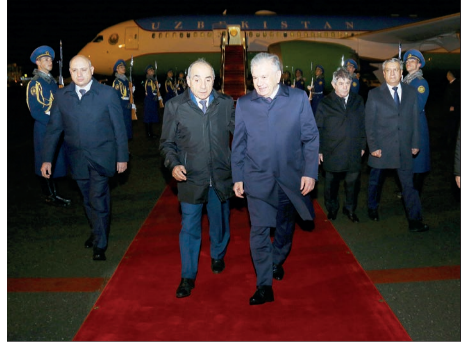
Özbəkistan Respublikasının Prezidenti Şavkat Mirziyoyev noyabrın 23-də Azərbaycan Respublikasına işgüzar səfərə gəlib.

Hər iki ölkənin Dövlət bayraqlarının dağalandığı Heydər Əliyev Beynəlxalq Aeroportunda ali qonağın şərəfinə fəxri qarovul dəstəsi düzülüb. Prezident Şavkat Mirziyoyevi hava