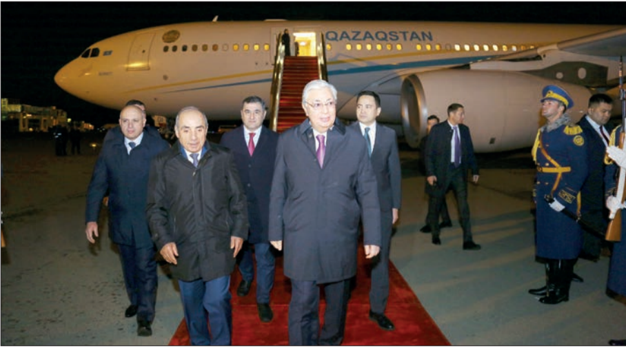
Qazaxıstan Respublikasının Prezidenti Kasim-Jomart Tokayev noyabrın 23-də Azərbaycan Respublikasına işgüzar səfərə gəlib.

Hər iki ölkənin dövlət bayraqlarının dağalandığı Heydər Əliyev Beynəlxalq Aeroportunda ali qonağın şərəfinə fəxri qarovul dəstəsi düzülüb.