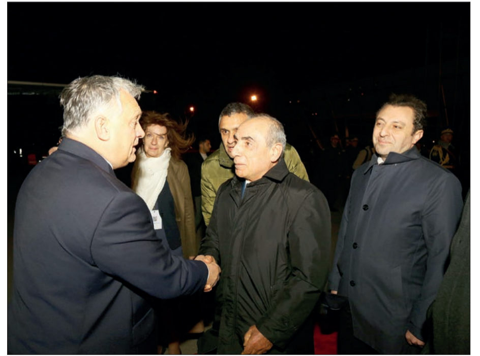
Macarıstanın Baş naziri Viktor Orban noyabrın 23-də Azərbaycan Respublikasına işgüzar səfərə gəlib.

Hər iki ölkənin Dövlət bayraqlarının dağalandığı Heydər Əliyev Beynəlxalq Aeroportunda ali qonağın şərəfinə fəxri qarovul dəstəsi düzülüb. Baş nazir Viktor Orbanı hava lima-