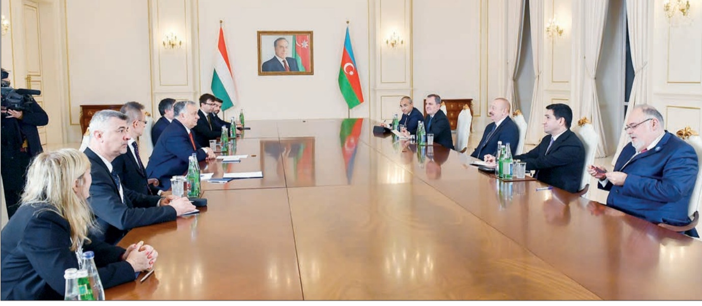
Noyabrın 23-də Azərbaycan Respublikasının Prezidenti İlham Əliyev Macarıstanın Baş naziri Viktor Orban ilə görüşüb.

Macarıstanın Baş naziri Viktor Orban SPECA-nın Zirvə görüşündə fəxri qonaq qismində iştirak üçün dəvətə görə dövlətimizin başçısına təşəkkürünü bildirdi. O, Macarıstan xalqının ən xoş arzularını və Azərbaycanın suverenliyinin bərpası, regionda vəziyyətin sabitləşməsi münasibətilə Prezident İlham Əliyevə təbriklerini çatdırdı.