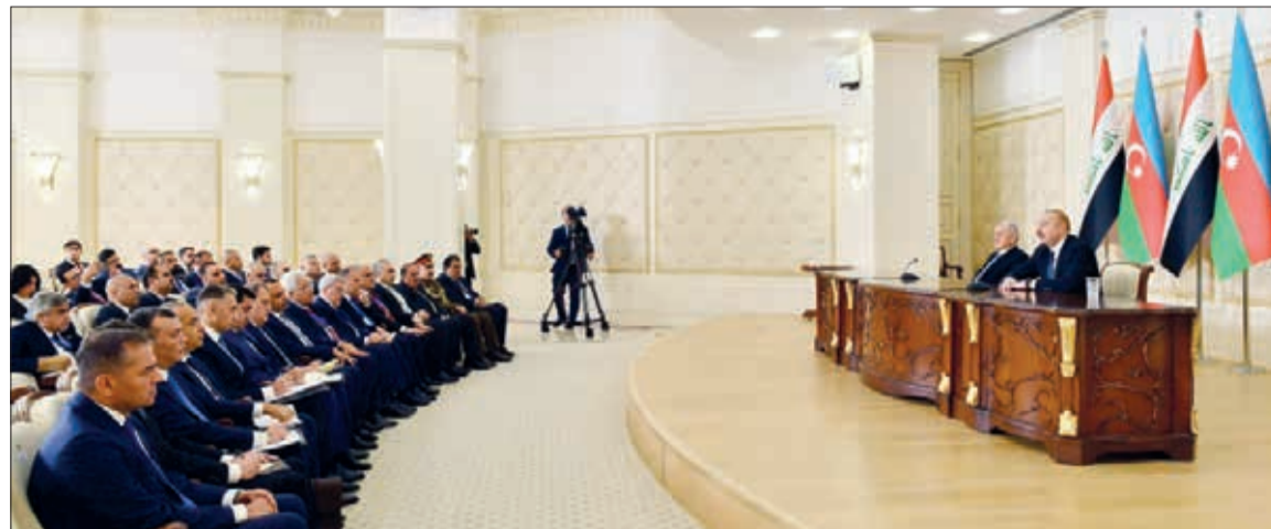
Noyabrın 20-də Azərbaycan Respublikasının Prezidenti İlham Əliyev və İraq Respublikasının Prezidenti Əbdüllətif Camal Rəşid mətbuata bəyanatlarla çıxış ediblər. Əvvəlcə Azərbaycan Prezidenti bəyanatla çıxış etdi.