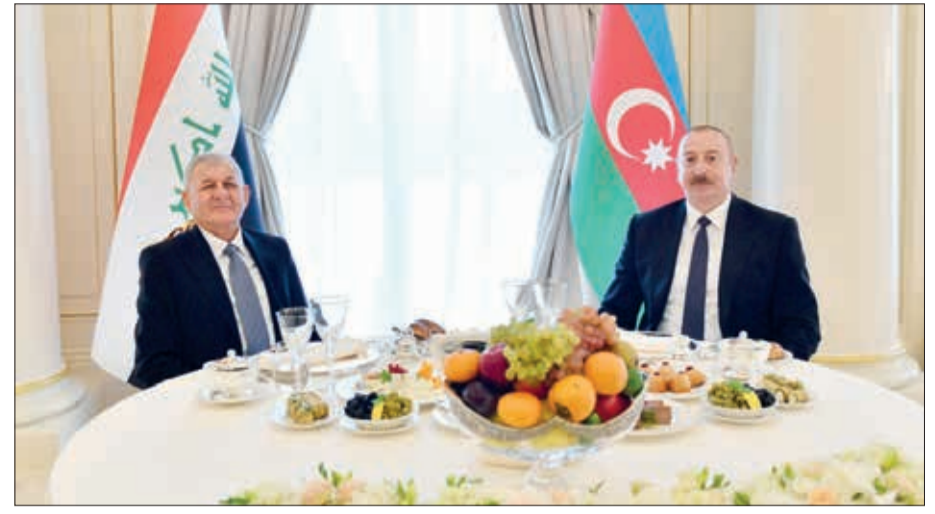
Noyabrın 20-də Azərbaycan Respublikasının Prezidenti İlham Əliyevin adından İraq Respublikasının Prezidenti Əbdüllətif Camal Rəşidin şərəfinə rəsmi nahar verilib.