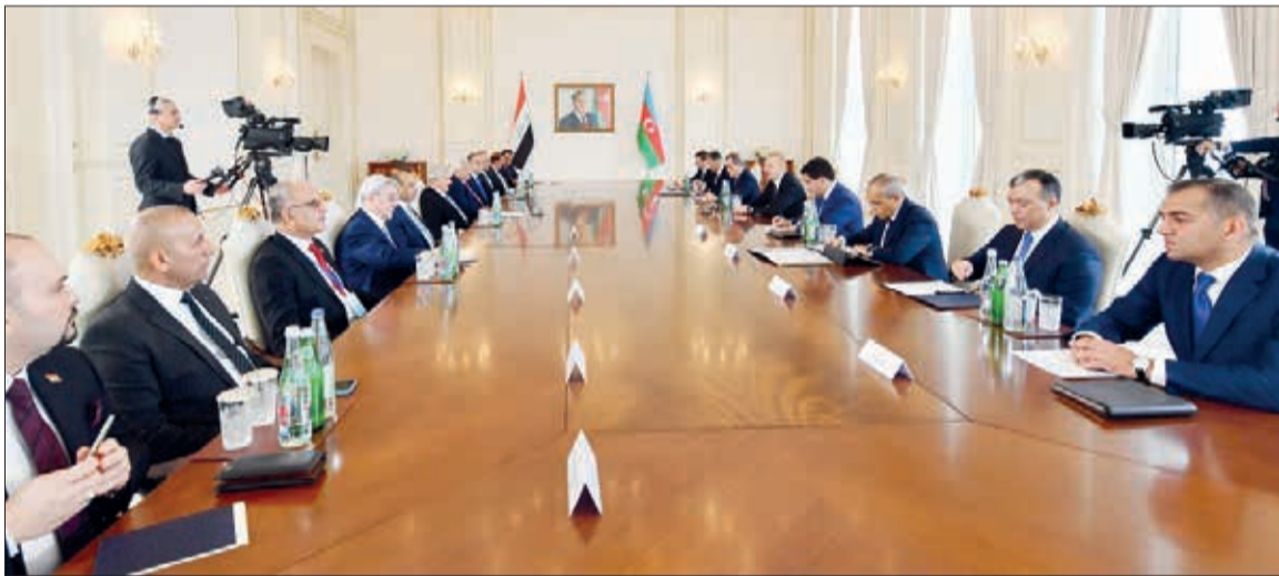
Noyabrın 20-də Azərbaycan Respublikasının Prezidenti İlham Əliyevin İraq Respublikasının Prezidenti Əbdüllətif Camal Rəşid ilə geniş tərkibdə görüşü olub.

Görüşdə çıxış edən Prezident İlham Əliyev dedi: