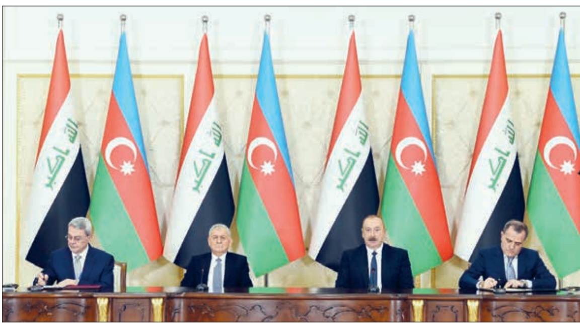
Noyabrın 20-də Azərbaycan Respublikasının Prezidenti İlham Əliyevin və İraq Respublikasının Prezidenti Əbdüllətif Camal Rəşidin iştirakı ilə sənədlərin imzalanması mərasimi olub.

Azərbaycan Respublikasının əmək və əhalinin sosial müdafiəsi naziri Sahil Babayev və İraq Respublikasının əmək və sosial işlər naziri Əhməd Casim Sabir Əl-Əsədi "Azərbaycan Respublikasının Əmək və Əhalinin Sosial Müdafiəsi Nazirliyi ilə İraq Respublikasının Əmək və Sosial İşlər Nazirliyi arasında əməkdaşlıq haqqında Anlaşma Memorandumu"nu imzaladılar.