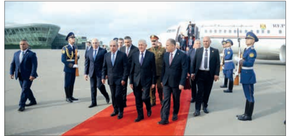
İraq Respublikasının Prezidenti Əbdüllətif Camal Rəşid noyabrın 19-da Azərbaycan Respublikasına rəsmi səfərə gəlib.

Hər iki ölkənin dövlət bayraqlarının dalğalandığı Heydər Əliyev Beynəlxalq Aeroportunda ali qonağın şərəfinə fəxri qarovul dəstəsi düzülüb.