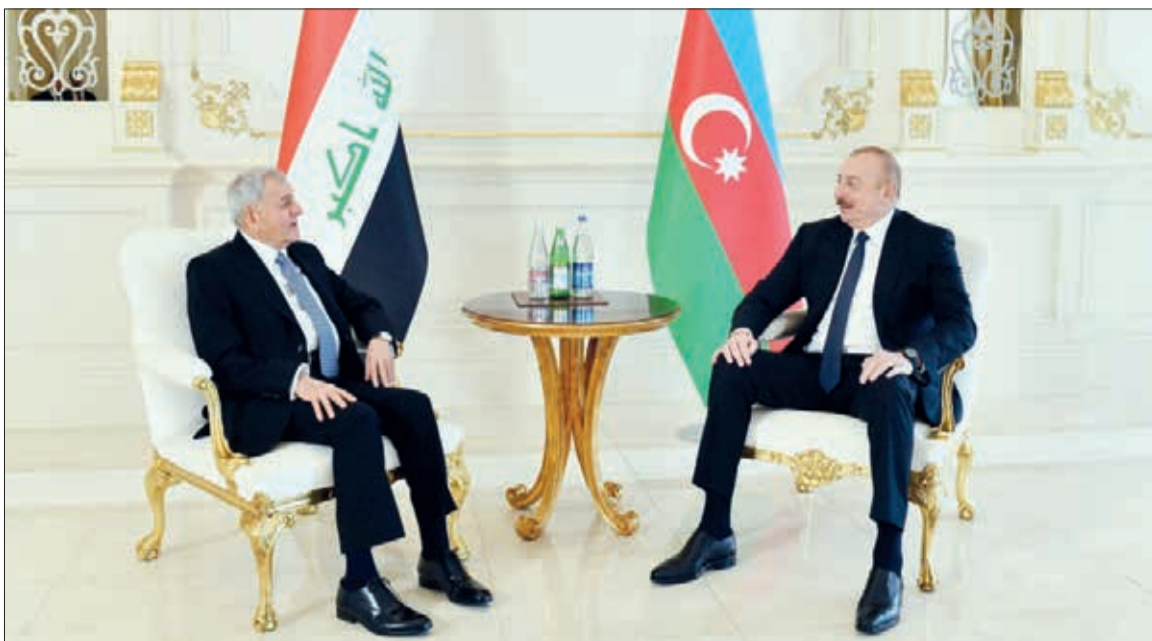
Noyabrın 20-də Azərbaycan Respublikasının Prezidenti İlham Əliyevin İraq Respublikasının Prezidenti Əbdüllətif Camal Rəşid ilə təkbətək görüşü keçirilib.

Dövlətimizin başçısı İraq Prezidentinin Qoşulmama Hərəkatının Zirvə toplantısı çərçivəsində Azərbaycana səfərini və keçirdikləri görüşü məmnuniyyətlə xatırladı. İraq Prezidentinin ölkəmizə ilk dəfə rəsmi səfərə gəlməsindən məmnunluğunu bildiren Prezident İlham Əliyev bu səfərin və səfər zamanı aparılacaq müzakirələrin ölkələrimiz arasında əlaqələrin daha da inkişafına mühüm töhfə verəcəyinə əminliyini ifadə etdi.