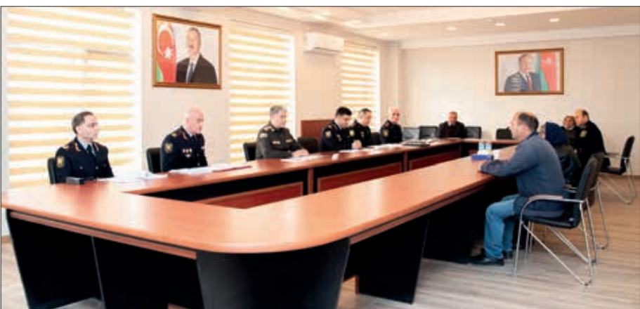
Daxili İşlər naziri general-polkovnik Vilayət Eyvazov noyabrın 14-də və 15-də Gəncə Şəhər Baş Polis İdarəsində vətəndaşlarla görüşüb.

Gəncə, Kəlbəcər, Xocalı, Goranboy, Samux, Göygöl, Naftalan və digər rayonlardan görüşə gələn 120 vətəndaşın müraciətini dinləyən nazir onların problemlərinin həlli üçün nazirliyin aidiyyəti bəş