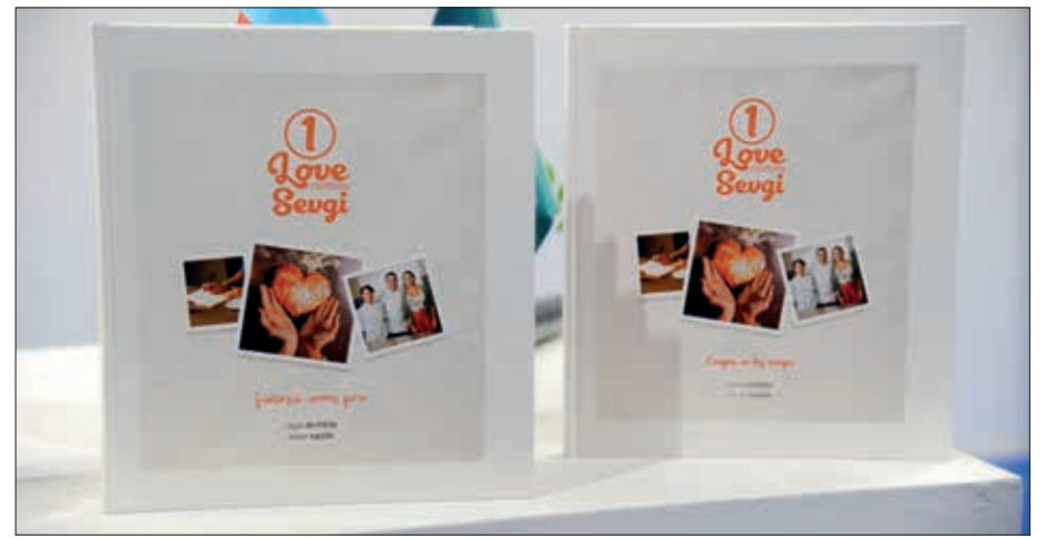
Bakı Ekspo Mərkəzində keçirilən 9-cu Bakı Beynəlxalq Kitab Sərgisində Leyla Əliyevanın "Sevgi" kitabının təqdimatı mərasimi olub.

"Şərç-Qərb" nəşriyyat evinin baş redaktoru Nərgiz Cəbbarlının moderatorluğu ilə keçirilən təqdimatda çıxış edən Xalq yazıçısı Elmira Axundova kitab haqqında ətraflı məlumat verib: "Leyla xanımın kitabları zövqlü, fəlsəfi və dərin mənalı kitablardır. Burada fərqli cəhət var. Kitabda Leyla xanımın şeirləri yer alıb. Leyla xanım öz üzərinə böyük məsuliyyət götürüb. O, dahi babası və atası kimi Azərbaycan üçün böyük işlər görür. Leyla xanım çox istedadlı və yaradıcı insandır".