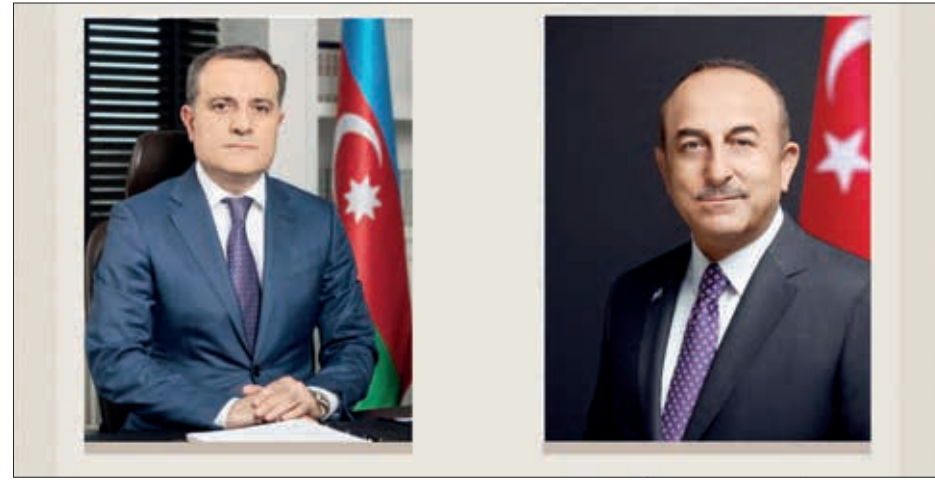
Dünya Azərbaycan Respublikasının Xarici İşlər naziri Ceyhun Bayramovla Türkiyə Respublikasının Xarici İşlər naziri Mövlud Çavuşoğlu arasında telefon danışıqları.

Xarici İşlər Nazirliyinin Mətbuat Xidməti İdarəsindən qəzetimizə bildirilib ki, telefon danışıqları zamanı Türkiyə