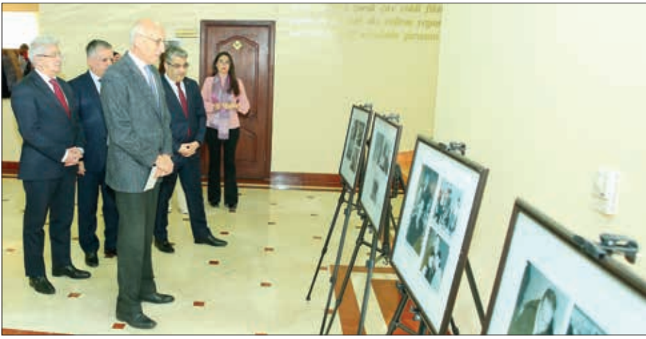
Ulu öndər Heydər Əliyev hər zaman Azərbaycan gəncliyinə qayğı ilə yanaşmış, gənclərin inkişafını xüsusi diqqət mərkəzində saxlayıb.

Bu fikirlər fevralın 16-da "Heydər Əliyev İli" çərçivəsində Milli Arxiv İdarəsində Yeni Azərbaycan Partiyası (YAP) Veteranlar Şurasının üzvlərinin gənclərlə keçirilən görüşündə səsləndirilib. Tədbirdə YAP-ın Binəqədi, Qaradağ və Zəngilan rayon təşkilatlarının üzvləri iştirak ediblər.