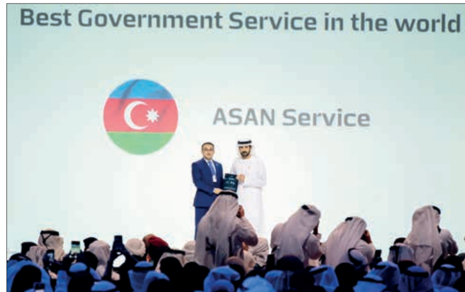
Birləşmiş Ərəb Əmirliklərinin Dubay şəhərində keçirilən 10-cu Dünya Hökumət Sammitində "ASAN xidmət" "Qlobal Hökumət Mükəmməlliyi Mükafatı" Proqramı çərçivəsində "Dünyanın IT Qabaqcıl Dövlət Xidməti" seçilib və xüsusi mükafata layiq görülüb.