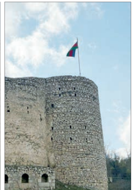
Azərbaycanın Birinci vitse-prezidenti Mehriban Əliyeva rəsmi "Instagram" səhifəsində Şuşadan fotolar paylaşılıb.

Birinci vitse-prezident paylaşımında yazıb: "Şuşa. 07.11.2023".