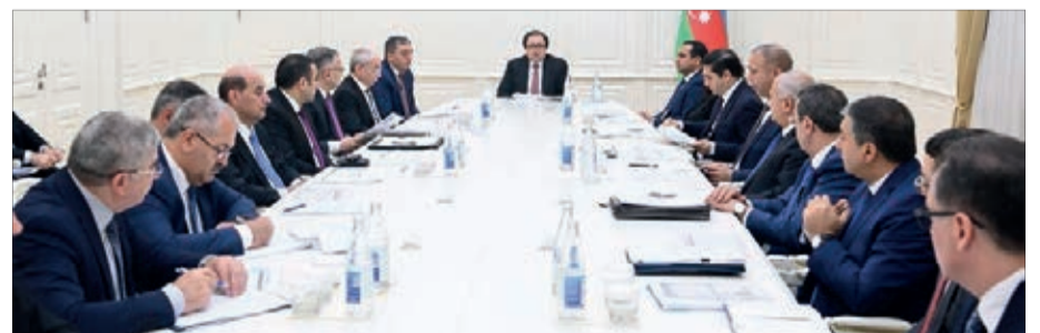
Azərbaycan Respublikasının Prezidenti İlham Əliyevin 2022-ci il 22 iyul tarixli Sərəncamı ilə təsdiq olunan "Azərbaycan Respublikasının 2022–2026-cı illərdə sosial-iqtisadi inkişaf Strategiyası"nın həyata keçirilməsi ilə bağlı görülməli işlər və tədbirlərin icra vəziyyəti barədə ildə 2 dəfə Azərbaycan Respublikasının Prezidentinə məlumatın verilməsi Azərbaycan Respublikasının Nazirlər Kabinetinə tapşırılıb.

Nazirlər Kabinetinin mətbuat xidmətidən bildirilib ki, noyabrın 6–7-də Azərbaycan Respublikası Nazirlər Kabineti Aparatının rəhbəri Rüfət Məmmədovun rəhbərliyi ilə "Strategiya"da nəzərdə tutulan tədbirlərin icrasının nəticələri haqqında iclas keçirilib. İclasda "Strategiya"nın məqsədləri üçün yaradılan 8 işçi qrupun üzvləri və əsas icraçı olan aidiyyəti dövlət qurumlarının rəhbərlərinin müavinləri iştirak ediblər.