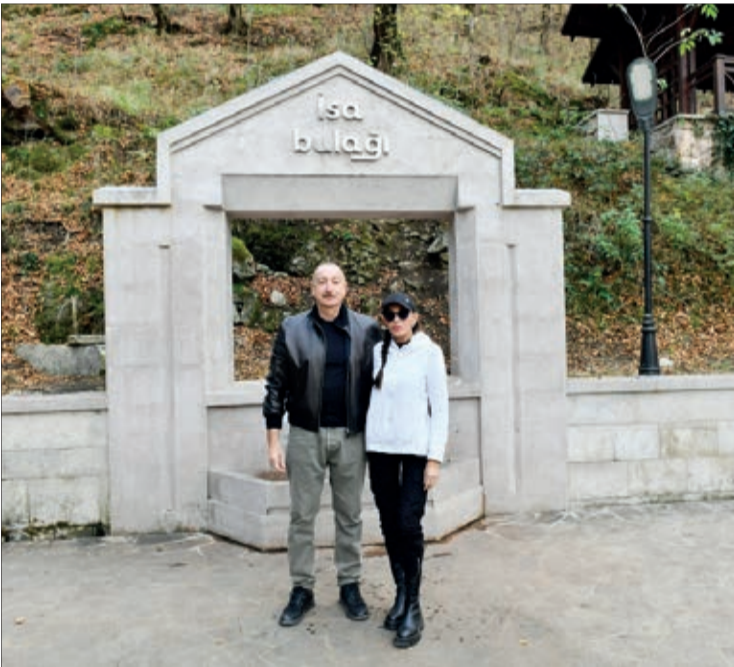
Azərbaycan Respublikasının Prezidenti İlham Əliyev və birinci xanım Mehriban Əliyeva noyabrın 7-də Şuşada İsa bulağında olublar.

Dövlətimizin başçısına və birinci xanımına İsa bulağının ətrafında görülməli işlər barədə məlumat verildi.