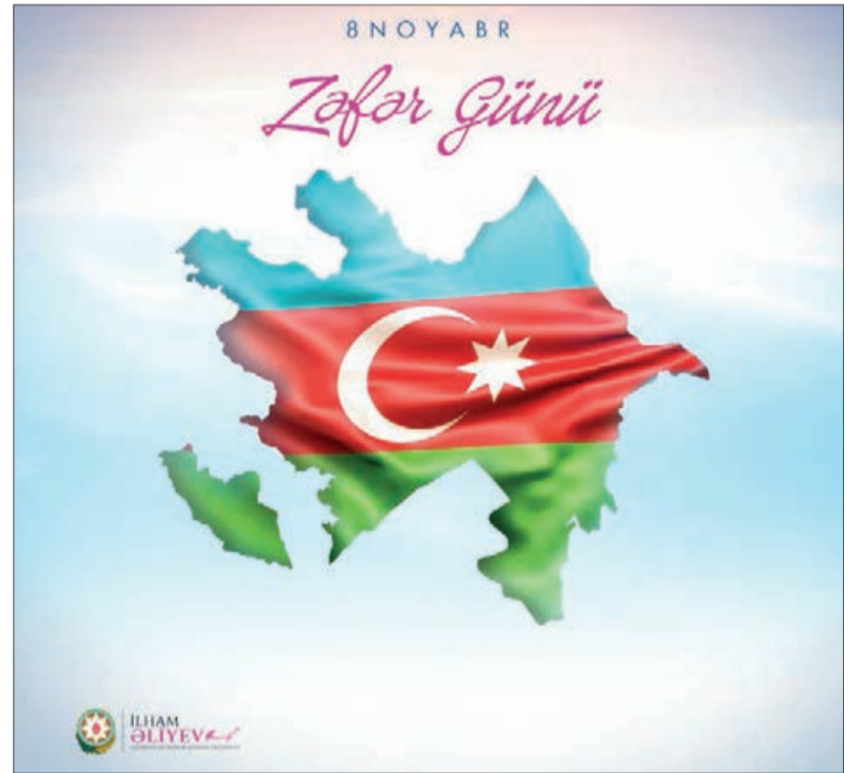
Azərbaycan Respublikasının Prezidenti İlham Əliyev 8 Noyabr – Zəfər Günü münasibətilə rəsmi sosial şəbəkə hesablarında foto paylaşım edib.