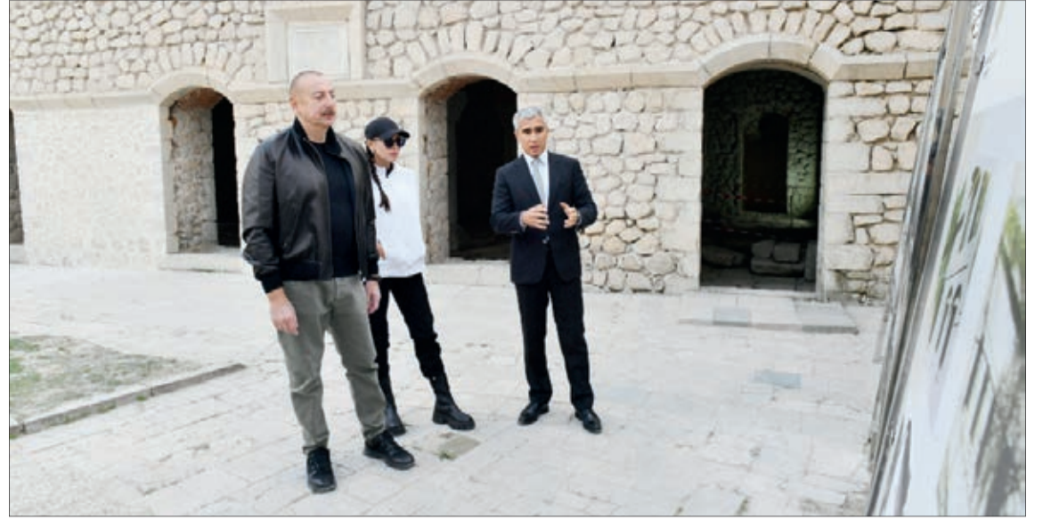
Azərbaycan Respublikasının Prezidenti İlham Əliyev və birinci xanım Mehriban Əliyeva noyabrın 7-də Şuşada Heydər Əliyev Fondu tərəfindən Mamayı məscidində aparılan bərpa işləri ilə tanış olublar.

Dövlətimizin başçısına və birinci xanımına görülməli işlər barədə məlumat verildi.