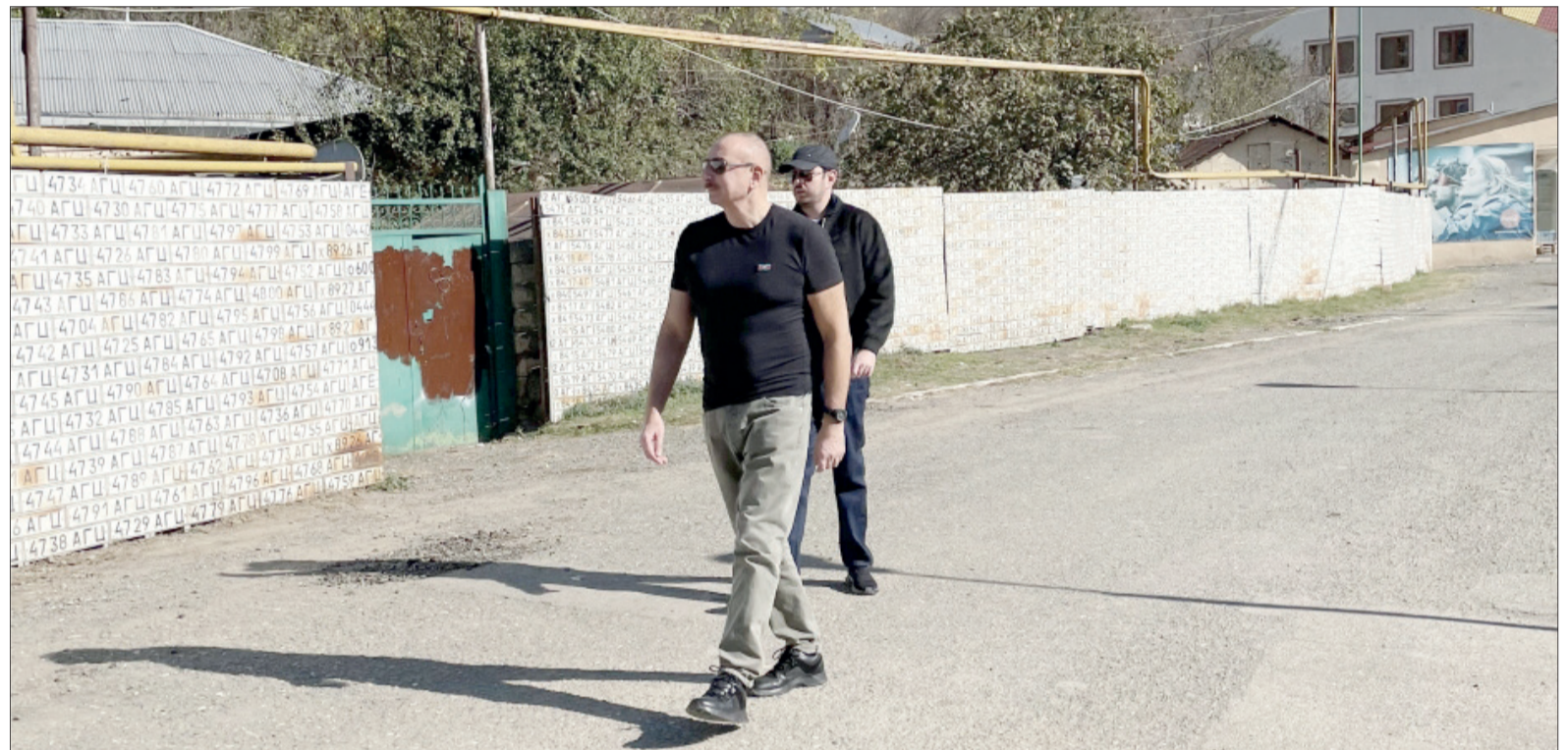
Azərbaycan Respublikasının Prezidenti İlham Əliyev, birinci xanım Mehriban Əliyeva və oğulları Heydər Əliyev noyabrın 7-də Kəlbəcər rayonunun Vəngli kəndində olublar.

Dövlətimizin başçısı və birinci xanım Kəlbəcər rayonunun Vəngli kəndində olublar