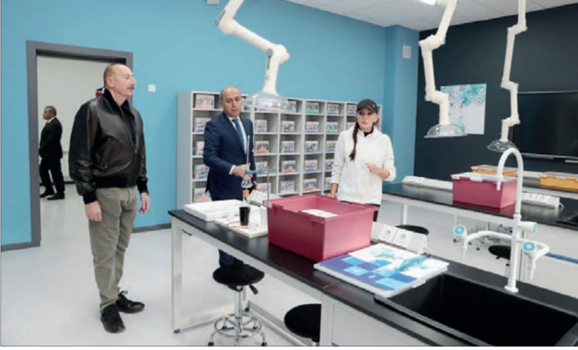
Azərbaycan Respublikasının Prezidenti İlham Əliyev və birinci xanım Mehriban Əliyeva noyabrın 7-də Şuşa şəhəri 1 nömrəli tam orta məktəbin açılışında iştirak ediblər.

Dövlətimizin başçısına və birinci xanımına məktəbdə yaradılan şərait barədə məlumat verildi.