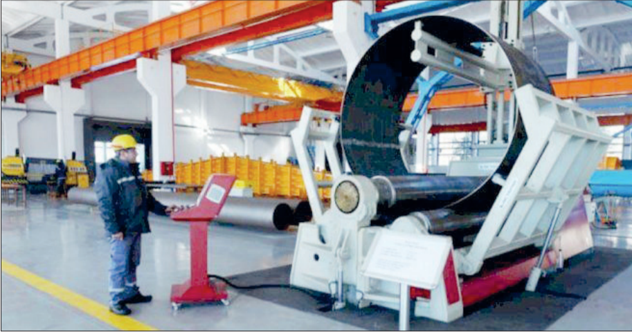
Hesablama Palatasının məlumatına əsasən, Azərbaycanda gələn il dövlət büdcəsindən “2022–2026-cı illərdə sosial-iqtisadi inkişaf Strategiyası”nın icrasına 5,6 milyard manat ayrılması nəzərdə tutulur.

Gələn il bu məqsədlərə 5,6 milyard manat xərclənəcək