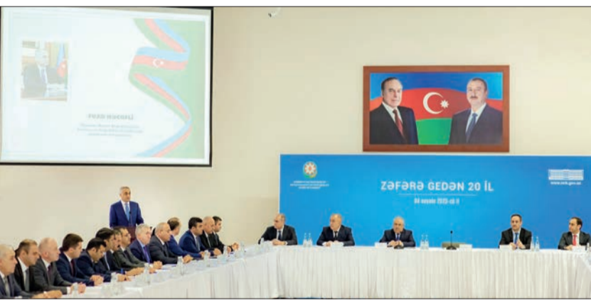
Dünya Naxçıvan Biznes Mərkəzində Naxçıvan Muxtar Respublikası Nazirlər Kabinetinin təşkilatçılığı ilə Azərbaycan Respublikasının Prezidenti İlham Əliyevin hakimiyyətə gəlişinin 20 illiyi və Zəfər Günü'nün 3-cü ildönümünə həsr olunmuş "Zəfərə gedən 20 il" mövzusunda tədbir keçirilib.