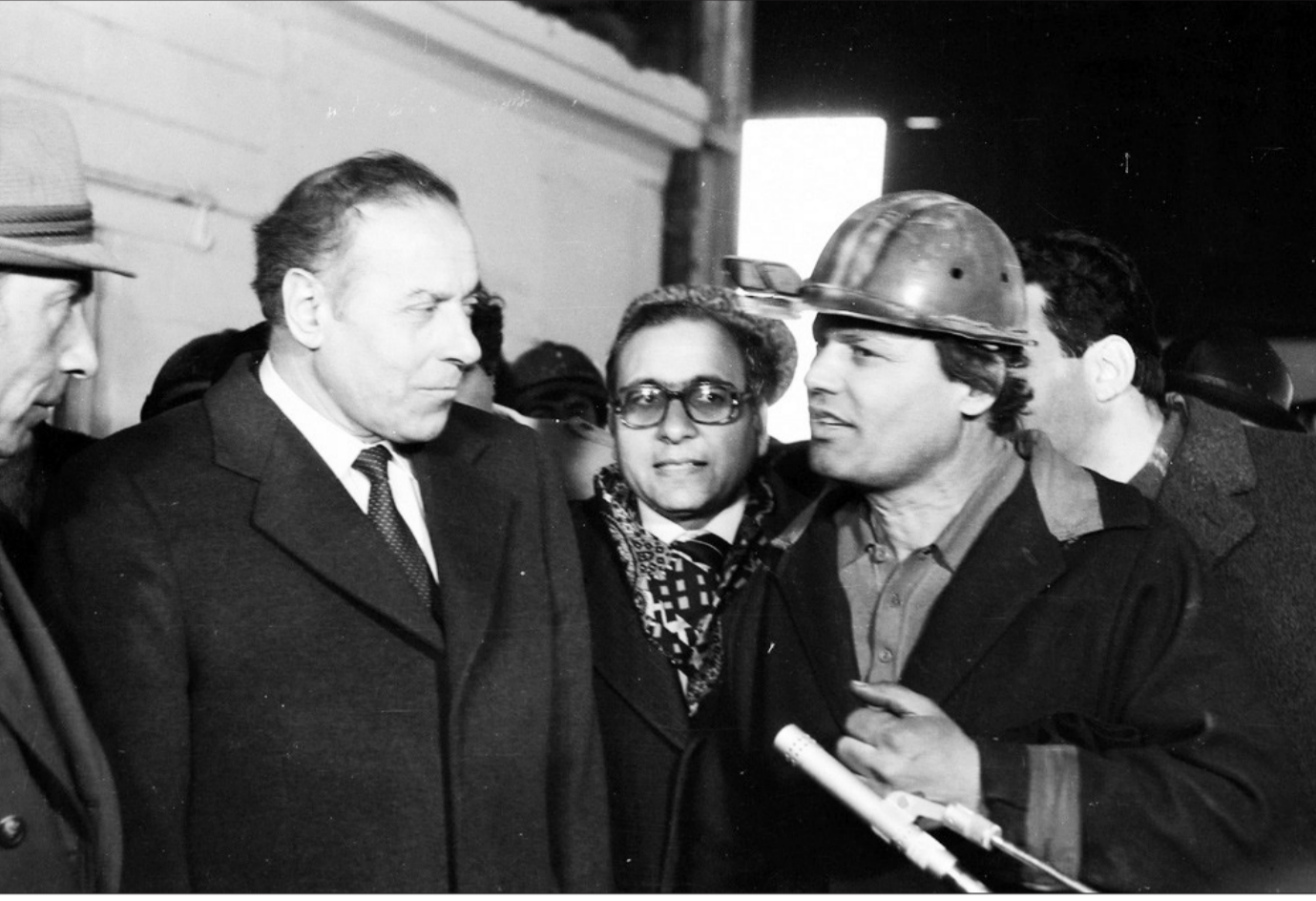
Sumqayıtın inkişafı, onun nökini keçmiş SSRİ-də, bütün dünyada tanınması Heydər Əliyevin adı ilə sıx bağlıdır. Həmin dövrdə Ulu öndərin böyük qayğısı sayəsində şəhər tarixinin əlamətdar səhifələri yazılıb. Məhz Heydər Əliyevin təşəbbüsü ilə Sumqayıtda yüngül sənaye müəssisələri yaradılıb, kimya sənayesi inkişaf etdirilib, yeni istehsal sahələri istismara verilib.