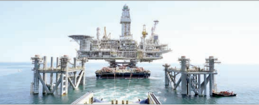
Azərbaycanın iqtisadi müstəqilliyi üçün möhkəm təməl, etibarlı baza yaradan “Əsrin müqaviləsi”nin imzalanmasından 29 il ötür. Əvvəlki dövrlərdə olduğu kimi, bu ilin 9 ayında da “Azəri-Çıraq-Günəşli” (AÇG) layihəsi üzrə tikinti-quraşdırma, qazma və hasilatla bağlı əməliyyatlar uğurla davam etdirilib.

9 ayda AGG layihəsi çərçivəsində daha 100 milyon barel neft hasil olunub