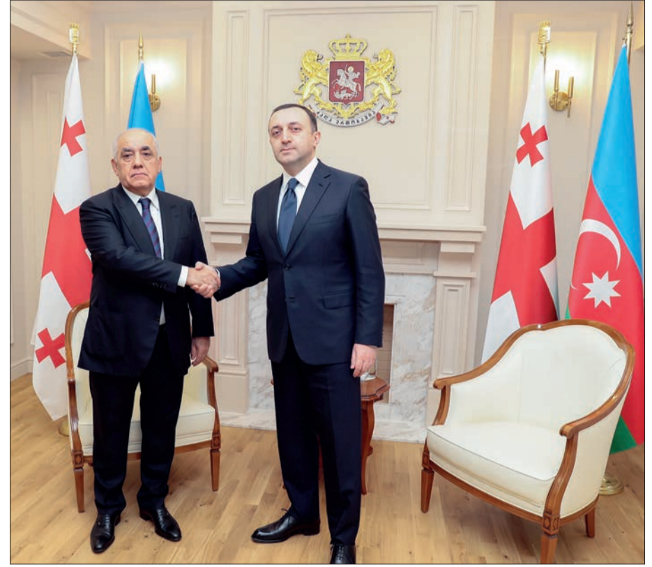
Oktyabrın 26-da Azərbaycanın Baş naziri Əli Əsədov Tbilisiyə işgüzar səfəri çərçivəsində Gürcüstanın Baş naziri İrakli Qaribaşvili ilə görüşüb.

Ə.Əsədov Gürcüstan paytaxtında keçirilən Tbilisi İpək Yolu Forumuna dəvətə görə təşəkkürünü bildirib, regional və global gündəlikdə duran iqtisadi və nəqliyyat məsələlərinin müzakirəsi baxımından tədbirin əhəmiyyətini vurğulayıb.