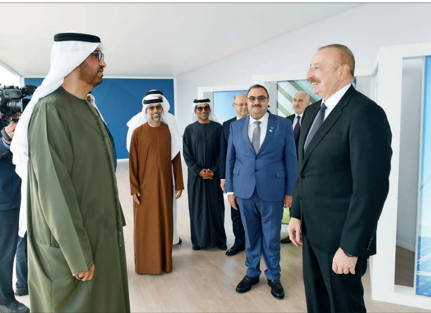
Oktyabrın 26-da 230 Mvt gücündə Qaradağ Günəş Elektrik Stansiyasının rəsmi açılış mərasimi olub.

Prezident İlham Əliyev 230 Mvt gücündə Qaradağ Günəş Elektrik Stansiyasının rəsmi açılış mərasimində