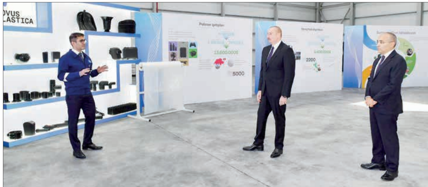
Azərbaycan Respublikasının Prezidenti İlham Əliyev oktyabrın 23-də Sumqayıt Kimya Sənaye Parkında yeni istehsal müəssisələrinin açılış və təmələqoyma mərasimlərində iştirak edib.

Kimya Sənaye Parkında yeni müəssisələrin açılışı və təmələqoyma