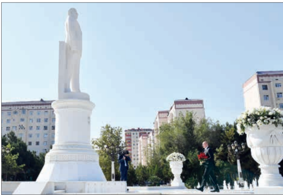
Azərbaycan Respublikasının Prezidenti İlham Əliyev oktyabrın 23-də Ulu Öndər Heydər Əliyevin Sumqayıt şəhərinin mərkəzində ucaldılan abidəsini ziyarət edib.

Ulu öndər Heydər Əliyevin abidəsini ziyarət