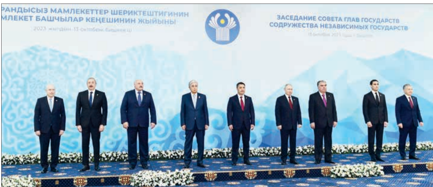
Oktyabrın 13-də Bişkekdə Müstəqil Dövlətlər Birliyi (MDB) Dövlət Başçıları Şurasının iclası keçirilib.

Prezident İlham Əliyev Bişkekdə MDB Dövlət Başçıları Şurasının iclasında iştirak edib