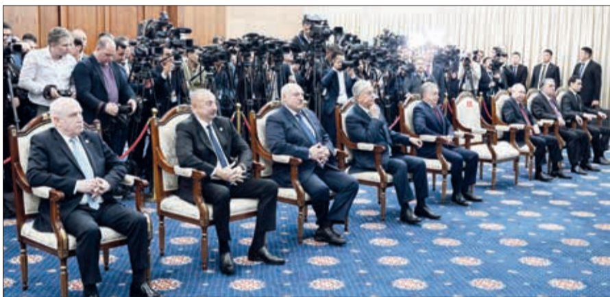
Oktyabrın 13-də Bişkekdə Özbəkistan Respublikasının Prezidenti Şavkat Mirziyoyevın MDB-nin Fəxri nişanı ilə təltif olunması mərasimi keçirilib.