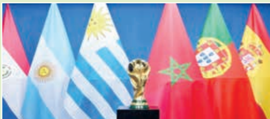
Futbol üzrə dünya çempionatı ilk dəfə 3 qitədə və 6 ölkədə keçiriləcək.

FİFA-nın rəsmi saytının məlumatına görə, 2030-cu ildə mundiala Mərakeş, İspaniya və Portuqaliya ev sahibliyi edəcək.