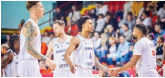
"Sabah" basketbol klubu FIBA Avropa Kubokunun A qrupunda sonuncu oyununu keçirib.

Rumıniyanın "Rapid" komandası ilə qarşılaşan Azərbaycan çempionu 90:71 hesabı ilə qələbə qazanıb. Bununla da, Bakı təmsilçisi müntəzəm mövsümdə iştirak hüququna sahib olub.