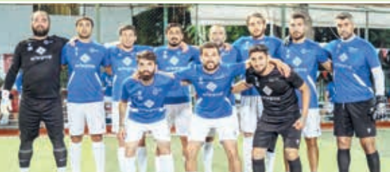
Minifutbol üzrə Azərbaycan milli komandası Türkiyədə yoldaşlıq görüşündə qələbə qazanıb.

Belek bölgəsində təlim-məşq toplanışında olan yığmamız Antalyanın "Tuncay İdman Yurdu" komandası üzərində 4:3 hesablı qələbə qazanıb.