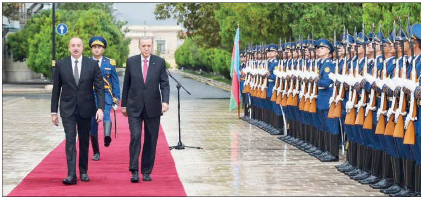
Sentyabrın 25-də Azərbaycana rəsmi səfərə gələn Türkiyə Respublikasının Prezidenti Rəcəb Tayyib Ərdoğanın Naxçıvanda rəsmi qarşılanma mərasimi olub.

Hər iki ölkənin dövlət bayraqlarının dalğalandığı meydana ali qonağın şərfinə fəxri qarovul dəstəsi düzülmüşdü.