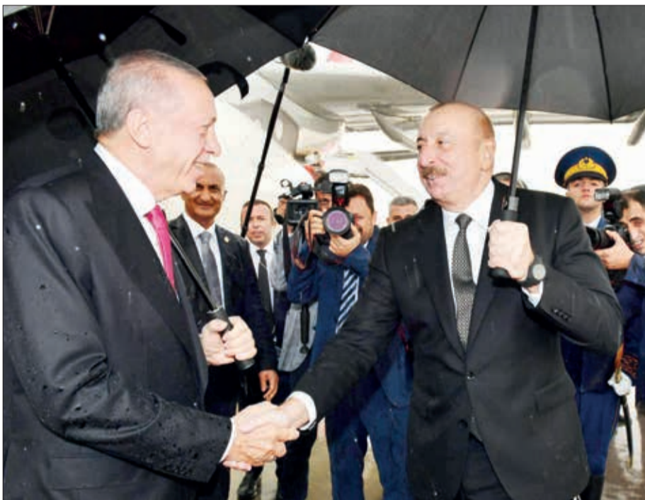
Sentyabrın 25-də Türkiyə Respublikasının Prezidenti Rəcəb Tayyib Ərdoğan Azərbaycan Respublikasına rəsmi səfərə gəlib.

Naxçıvan Beynəlxalq Hava Limanında Türkiyə dövlətinin başçısının şərfinə fəxri qarovul dəstəsi düzülmüşdü.