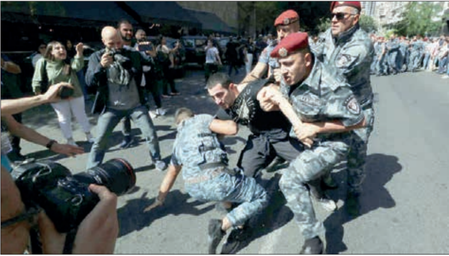
(əvvəlki 1-ci səhifədə)

Radikal-revanşistlər və daşnaklar iğtişaş törətmək niyyətindədir