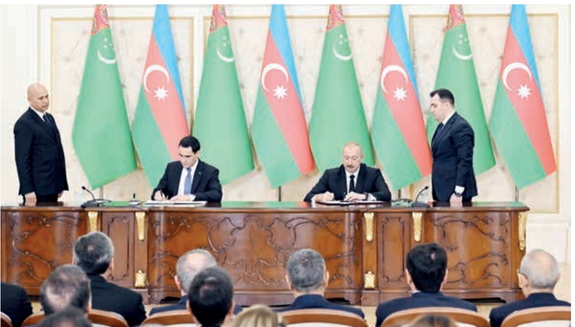
Azərbaycan Respublikası ilə Türkmənistan arasında imzalanmış sənədlərin iyunun 22-də Azərbaycan Prezidenti İlham Əliyevin və Türkmənistan Prezidenti Sərdar Berdiməhəmmədovun iştirakı ilə mübadiləsi mərasimi olub.

Əvvəlcə Azərbaycan Respublikasının Prezidenti İlham Əliyev və Türkmənistan Prezidenti Sərdar Berdiməhəmmədov prezidentlərin Birgə Bəyanatını imzaladılar.