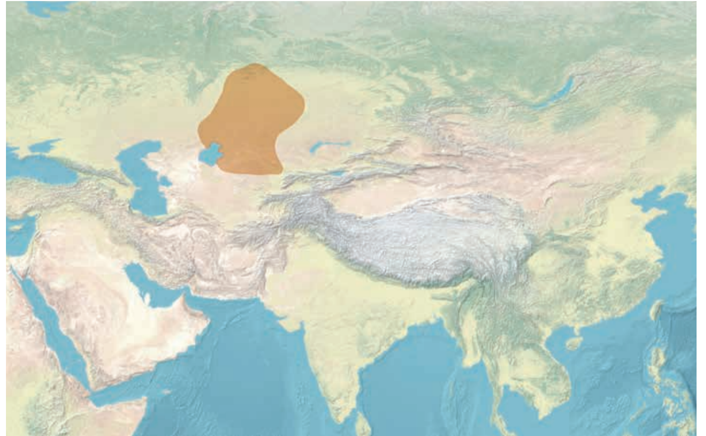
Özbək xanlığı güclü vaxtlarda

ətraflı məlumatlar XVI əsrdə yazılan “Şəcarəyi-Türk”, “Təvərix-i-Güzidəyi-Nüsrə-namə” və “Məcmə ət-Təvərix” kimi əsərlərdə qorunub.