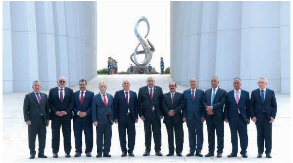
İordaniya Haşimilər Krallığı Nümayəndələr Palatasının sədri Mazen Torki Saud Əl-Qadi ölkəmizə rəsmi səfəri çərçivəsində iyunun 22-də Fəxri xiyabana gələrək xalqımızın Ümummilliyet lideri, müasir müstəqil Azərbaycan dövlətinin memarı və qurucusu Heydər Əliyevin xatirəsini ehtiramla yad edib, məzarı önünə əkilil qoyub.

Nümayəndə heyəti, həmçinin Bakıda Zəfər parkını ziyarət edərək abidə önünə əkilil qoyub, Vətən müharibəsində həlak olanların xatirəsini ehtiramla anıb.