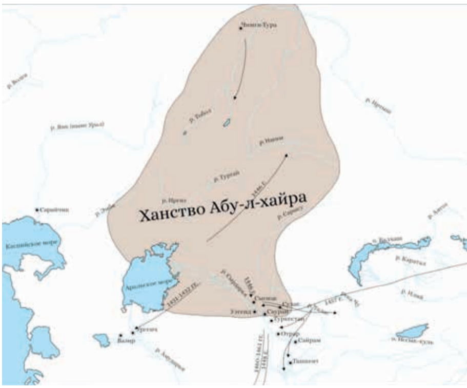
Özbək xanlığının ərazisi

oxuyur və xana hədiyyə edir və xan məclisdə iştirak edən Hüseyin Xarəzmiyə ona şərh yazmasını buyurur. Şərh cığatay türkcəsinə yazılmış və Kamaləddin Hüseyin Xarəzmi onu “Kaşf əl-Xuda” (“Həqiqi yolun aşkarlanması”) adlandırıb. O, həmçinin, Əbülxeyr xana həsr olunmuş bir qəsiddə yazıb.