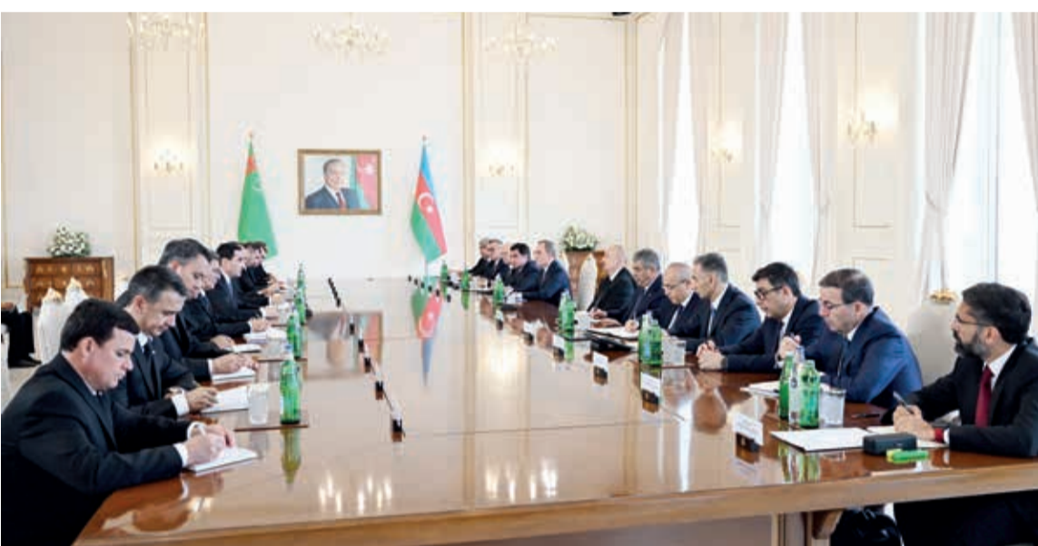
İyunun 22-də Azərbaycan Respublikasının Prezidenti İlham Əliyevin Türkmənistan Prezidenti Sərdar Berdiməhəmmədov ilə geniş tərkibdə görüşü olub.

Azərbaycana dövlət səfərinə gəldiyinə görə Türkmənistan Prezidenti Sərdar Berdiməhəmmədova təşəkkür edən dövlətimizin başçısı İlham Əliyev bu səfərə çox böyük əhəmiyyət verdiyini, onun ölkələrimiz arasında dostluq, qardaşlıq münasibətlərinin möhkəmlənməsinə xidmət göstərəcəyinə əminliyini ifadə etdi.