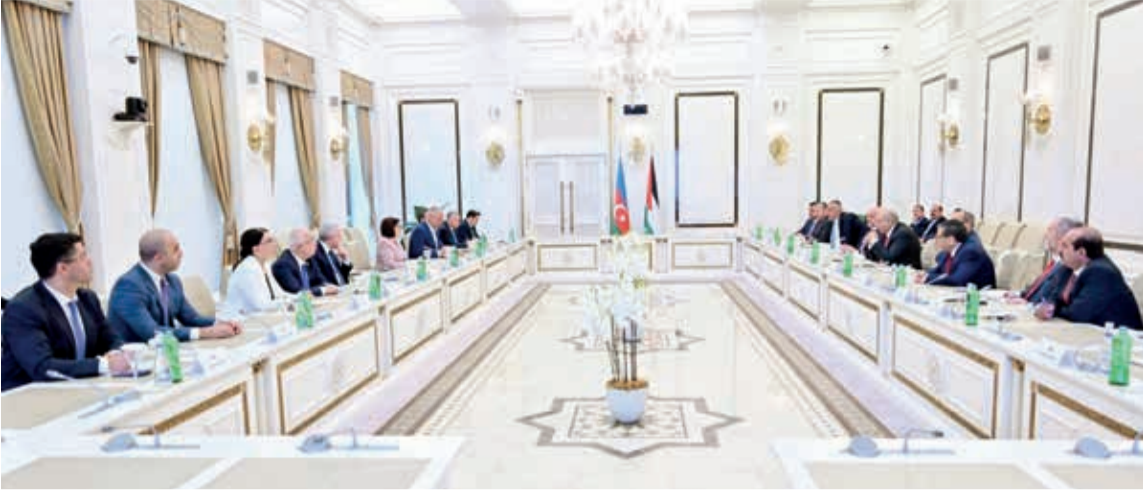
İyunun 22-də ölkəmizdə rəsmi səfərdə olan İordaniya Haşimilər Krallığı Nümayəndələr Palatasının sədri Mazen Torki Əl-Qadinin başçılıq etdiyi nümayəndə heyəti Milli Məclisə gəlib.

Nümayəndələr Palatasının sədri əvvəlcə Milli Məclisin plenar iclas zalı ilə tanış olub. Ulu öndər Heydər Əliyevin adını daşıyan xatirə zalına gələn qonaqlar burada Azərbaycan xalqının ümummilliyet lideri Heydər Əliyevin həyatının və siyasi fəaliyyətinin müxtəlif dövrlərini əks etdirən eksponatlarla tanış olub.