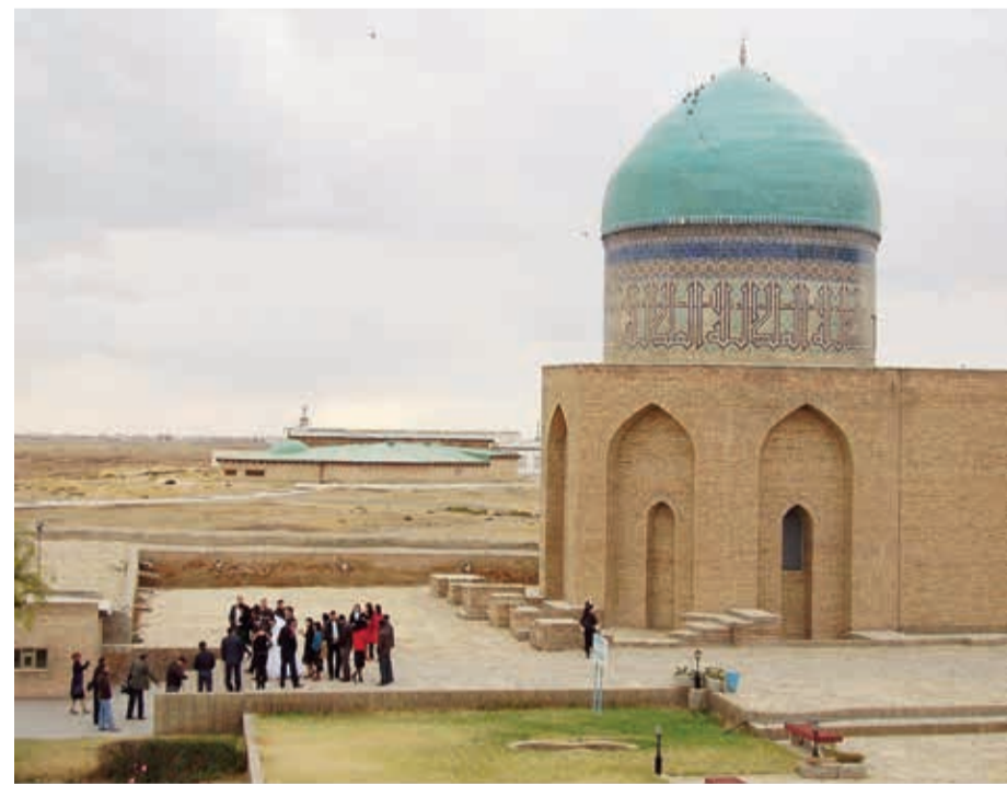
Türkiyədə Əbülxeyr xanın xanını Rəbiyyə Sultan bəyimin türbəsi

Bu tarixi şəxslərin çoxu haqqında məlumatlar əsasən şəcərə xarakterlidir. Daha