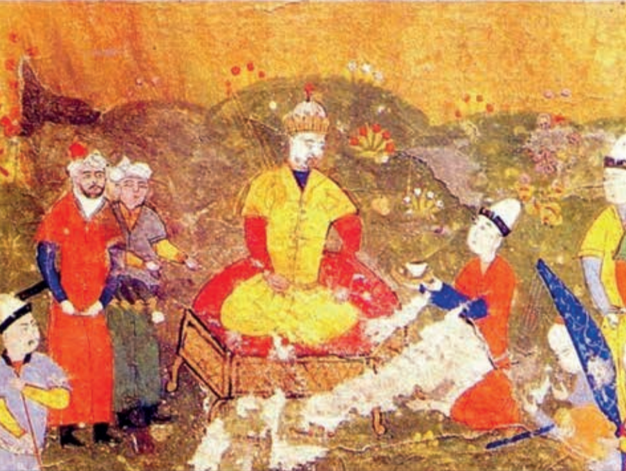
Əbülxeyr xan taxtda

Batı xanın qardaşı Şeybanın nəslindən olan Əbülxeyr xan XV əsrin ortalarında parçalanmış cöl tayfalarını öz ətrafında toplayaraq vahid siyasi hakimiyyət altında birləşdirdi. Qərbi Sibir çöllərində və Dəşti-Qıpçaq ərazilərində güclü Özbək xanlığının əsasını qoydu, bu, regionda yaranan yeni bir siyasi güc idi.