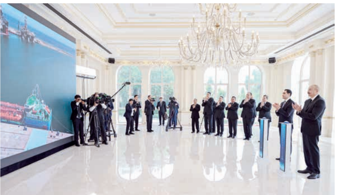
İyunun 22-də Azərbaycan Respublikasının Prezidenti İlham Əliyevin və Türkmənistan Prezidenti Sərdar Berdiməhəmmədovun iştirakı ilə “Dostluq” neftdaşıyan tankerinin onlayn formatda hədiyyə olunması mərasimi keçirilib.

Azərbaycan tərəfindən Türkmənistana hədiyyə edilən “Dostluq” neftdaşıyan tankeri Bakı gəmiqayırma zavodunda inşa olunub. Tankerin ümumi uzunluğu 141 metr, eni 16,9 metr, suya oturma isə 4,54 metrdir. Dedveytı 7875 ton olan tankerin Azərbaycanda inşası gəmiqayırma sənayemizin inkişafını nümayiş etdirməklə yanaşı, Azərbaycan-Türkmənistan dostluq əlaqələrinin inkişafına da töhfədir. Bu, eyni zamanda, Bakı gəmiqayırma zavodunda irihəcmli və texnoloji baxımdan mürəkkəb gəmiqayırma layihələrinin həyata keçirilməsinin mümkün olduğunu bir daha göstərir.