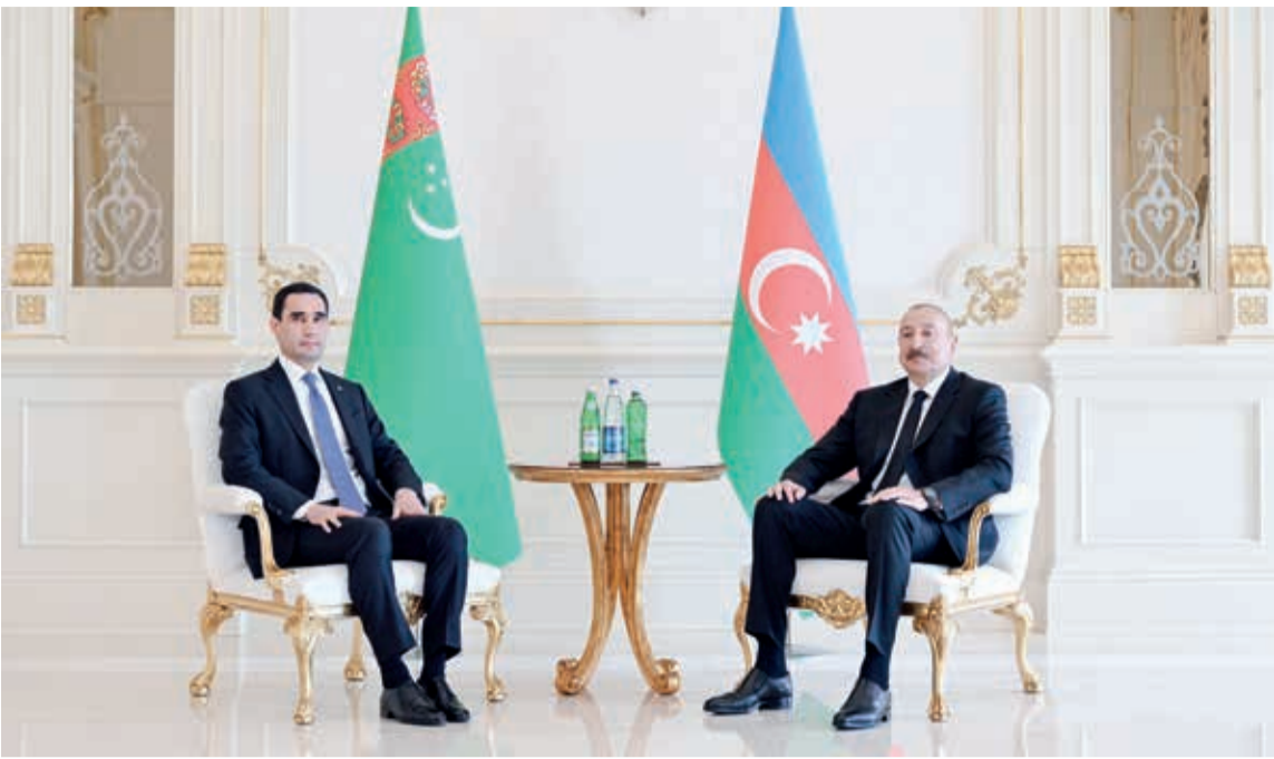
İyunun 22-də Azərbaycan Respublikasının Prezidenti İlham Əliyevin Türkmənistan Prezidenti Sərdar Berdiməhəmmədov ilə təkbətək görüşü olub.