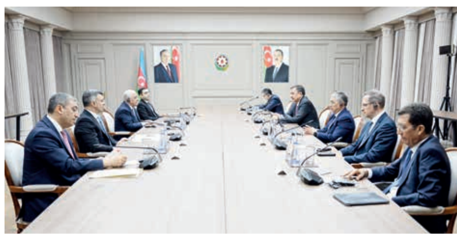
Azərbaycan Respublikasının Baş naziri Əli Əsədov iyunun 4-də Bakıda keçirilən Türk Dövlətləri Təşkilatına (TDT) üzv ölkələrin mərkəzi bankları Şurasının iclasının iştirakçıları ilə görüşüb.

Nazirlər Kabinetindən görüşdə Şurasının iclasının əhəmiyyəti vurğulanıb, tədbirin TDT-yə üzv ölkələrin maliyyə