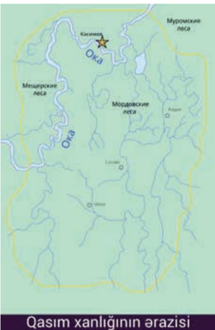
Qasım xanlığının ərazisi