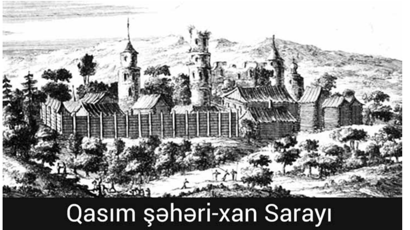
Qasım şəhəri-xan Sarayı

Bu ərazidə yaşayan mordvinlər, eləcə də meşçera və murom kimi digər Volqa Fin-Uqor tayfaları tatarlar tərəfindən asimilyasiya olunaraq mişar tatarlarına çevrilirdi. Sonradan bu ərazilərdə rusların məskunlaşdırılmasına başlanırdı. Qazan tatarlarının bir hissəsi Qasım torpaqlarına köçürülür. Tatarların əksəriyyəti xan sarayında orduya xidmət edirdi.