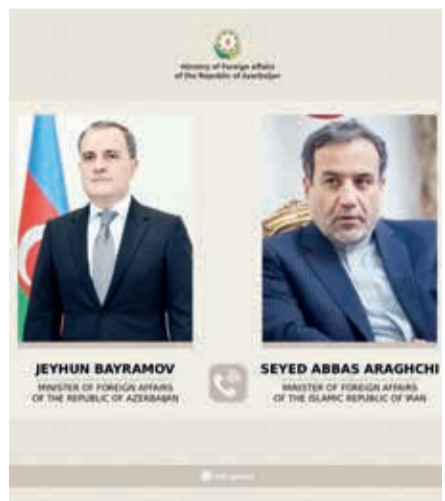
Azərbaycanın xarici işlər naziri Ceyhun Bayramov ilə İrannın xarici işlər naziri Seyid Abbas Əraqçı arasında telefon danışıqları.

Telefon danışıqları zamanı Azərbaycan-İran ikitərəfli münasibətlərinin cari vəziyyəti və əməkdaşlıq perspektivləri, habelə regionda mövcud vəziyyət və təhlükəsizlik məsələləri müzakirə olunub.