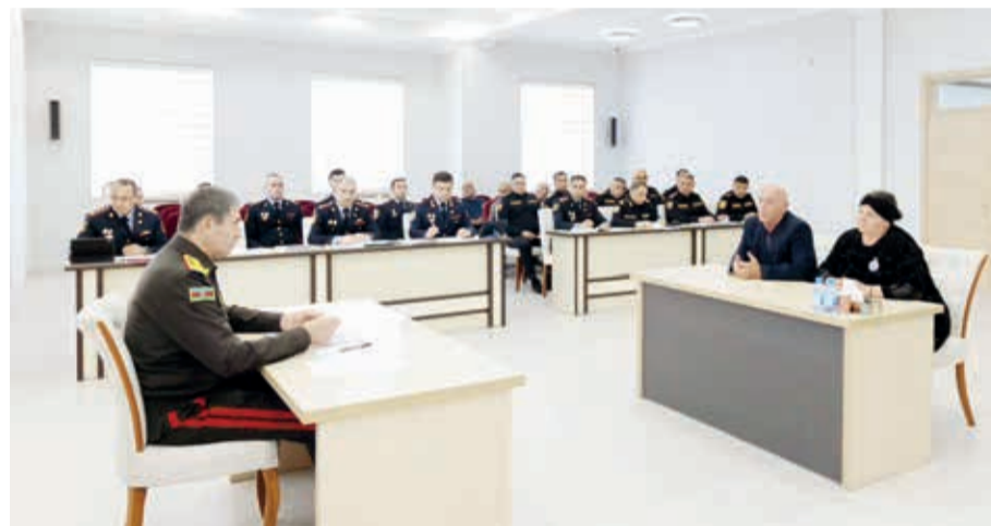
Azərbaycan Respublikasının Prezidenti cənab İlham Əliyevin tapşırığına və bölgələr üzrə vətəndaş qəbulu cədvəlinə uyğun olaraq daxili işlər naziri general-polkovnik Vilayət Eyvazov iyunun 3-də və 4-də Qazax rayonunda növbəti vətəndaş qəbulu keçirib.

Nazir əvvəlcə Qazax rayonunda ümummilli lider Heydər Əliyevin abidəsini ziyarət edərək əziz xatirəsini dərin hörmət və ehtiramla yad edib.