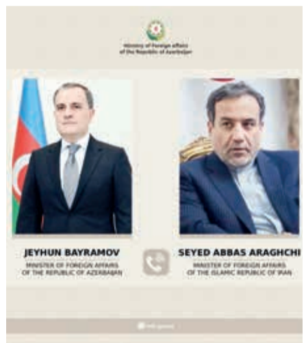
Azərbaycanın xarici işlər naziri Ceyhun Bayramov ilə İrannın xarici işlər naziri Seyid Abbas Əraqçı arasında telefon danışıqları.

Telefon danışıqları zamanı Azərbaycan-İran ikitərəfli münasibətlərinin cari vəziyyəti və əməkdaşlıq perspektivləri, habelə regionda mövcud vəziyyət və təhlükəsizlik məsələləri müzakirə olunub.