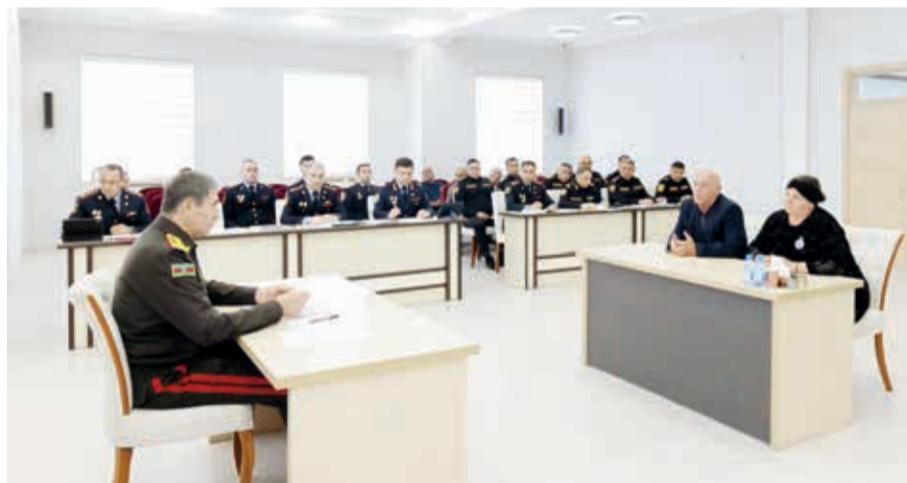
Azərbaycan Respublikasının Prezidenti cənab İlham Əliyevin tapşırığına və bölgələr üzrə vətəndaş qəbulu cədvəlinə uyğun olaraq daxili işlər naziri general-polkovnik Vilayət Eyvazov iyunun 3-də və 4-də Qazax rayonunda növbəti vətəndaş qəbulu keçirib.

Nazir əvvəlcə Qazax rayonunda ümummilli lider Heydər Əliyevin abidəsini ziyarət edərək əziz xatirəsini dərin hörmət və ehtiramla yad edib.