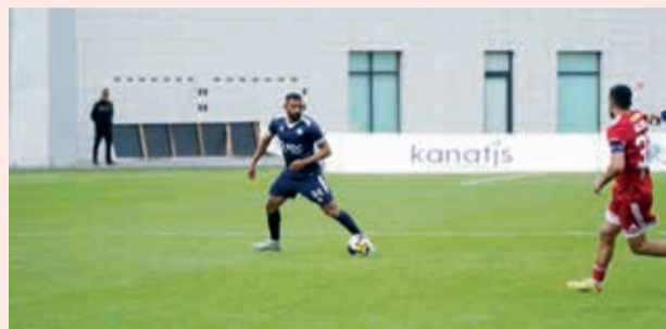
Futbol üzrə Azərbaycan Premyer Liqasında XXXI tura start verilib.

Dünən baş tutan açılış matçında "İmişli" və "Zira" komandaları qarşılaşıb. Quba Olimpiya İdman Kompleksinin stadionunda keçirilən görüş qolsuz heç-heçə ilə yekunlaşıb – 0:0.