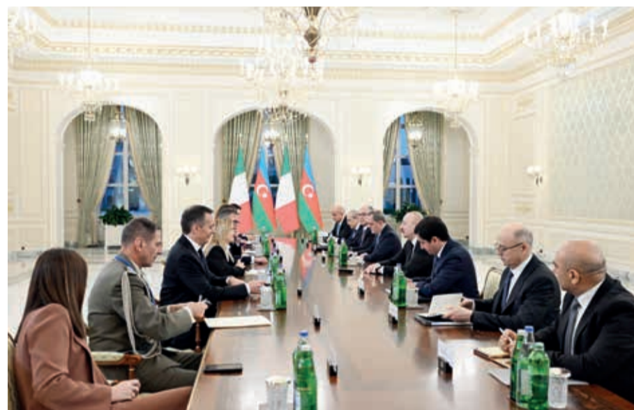
Mayın 4-də Azərbaycan Respublikasının Prezidenti İlham Əliyevin İtaliya Respublikası Nazirlər Şurasının sədri Ciorcia Meloni ilə geniş tərkibdə görüşü olub. Görüşdə çıxış edən Prezident İlham Əliyev dedi:

– Xanım Baş nazir, nümayəndə heyətinin üzvləri, bir daha xoş gəlmisiniz. Bizim müxtəlif aspektlər üzrə mükəmməl danışıqlarımız oldu. İndi danışıqlarımızı geniş tərkibdə davam etdirəcəyik. Əvvəlcə bizimlə bir yerdə olduğunuz üçün Sizə bir daha təşəkkür edirəm. Bu səhər, hətta dünəndən bəri necə məşğul olduğunuzu bilirəm. Ermənistandan gələrkən bizi ziyarət etməyiniz çox rəməzi mənə daşıyır. Bu, bir daha Azərbaycanla dost münasibətin olduğunu göstərir. Bizim də İtaliyaya eyni münasibətimiz var. Sizin bugünkü səfəriniz strateji münasibətlərimizin inkişafında çox həlledici olacaq. Bir daha xoş gəlmisiniz.