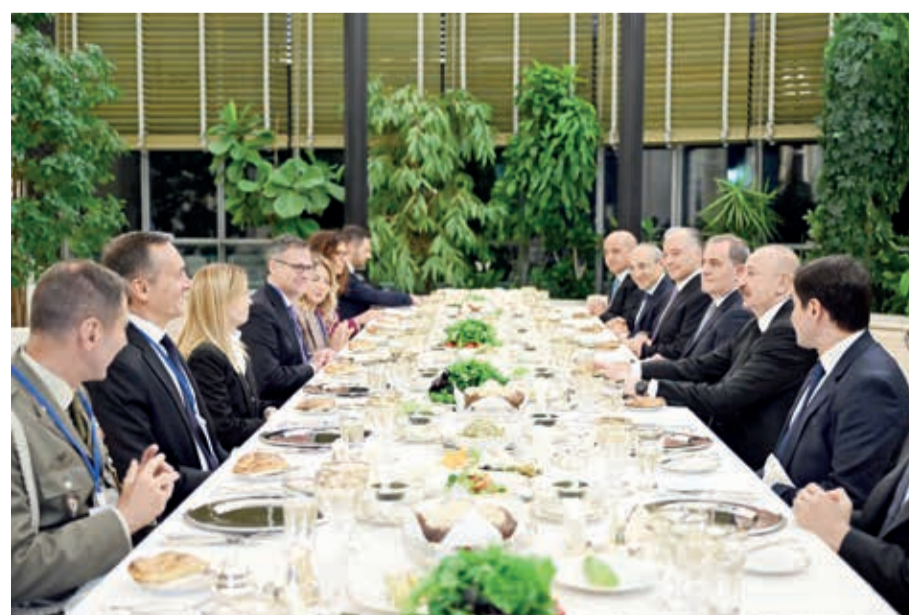
Mayın 4-də Azərbaycan Respublikasının Prezidenti İlham Əliyevin adından İtaliya Respublikası Nazirlər Şurasının sədri Ciorcia Meloninin şərəfinə işçi şam yeməyi verilib.