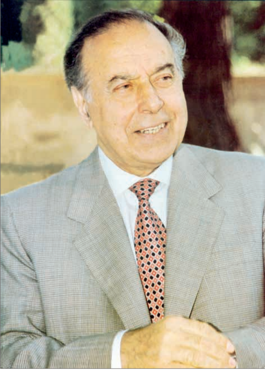
(əvvəlki qəzetimizin ötən saylarında)