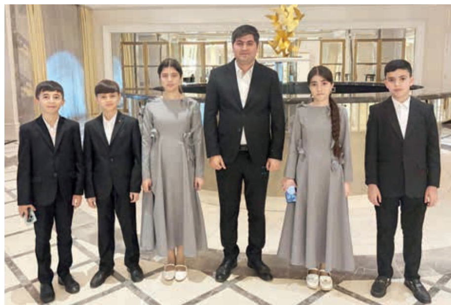
Axşam üstü qoy uzadıqdan Havalansın Xanın səsi, Qarabağın şikəstəsi.

Könüm keçir Qarabağdan Gah bu dağdan, gah o dağdan