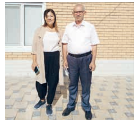
Anadolu türkləri niyə yada düşmədi?

Tədqiqatçımdan utandım və aşırım "Gül, ay gözəl, mən qocaya bir də gül" ifadəsi ilə özümə təsəlli tapdım. Özümə gələndən sonra isə fikirləşdim ki, o qızın sadaladığı siyahıda