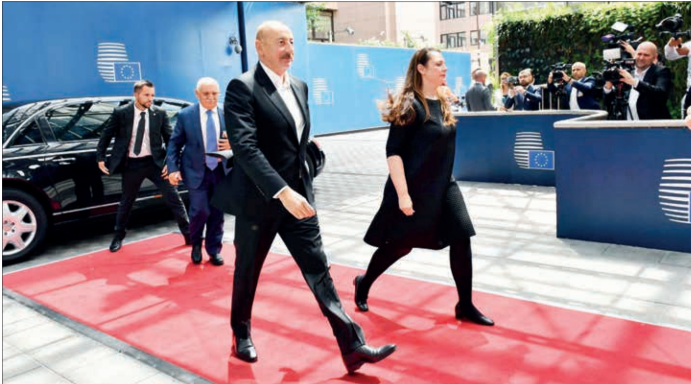
İyulun 15-də Brüsseldə Azərbaycan Respublikasının Prezidenti İlham Əliyevin Avropa İttifaqı Şurasının Prezidenti Şarl Mişel və Ermənistan Respublikasının baş naziri Nikol Paşinyan ilə üçtərəfli görüşü olub.

Prezident İlham Əliyevin Brüsseldə Avropa İttifaqı Şurasının Prezidenti və Ermənistanın baş naziri ilə üçtərəfli görüşü olub