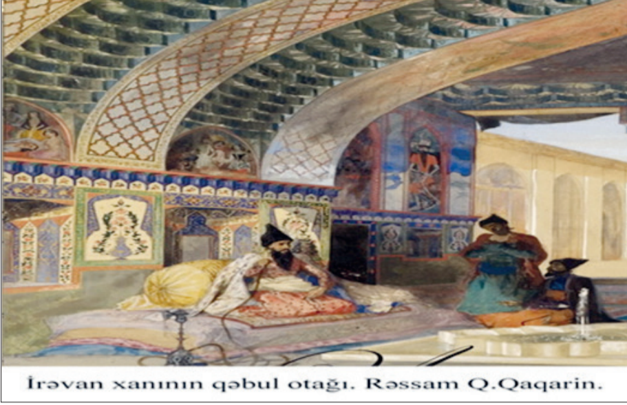
İrəvan xanının qəbul otağı. Rəssam Q. Qaqarın.

1747-ci ildə Azərbaycanda yaranan kiçik feodal dövlətlərdən biri də İrəvan xanlığı olub. Əsasən Qacarların idarə etdiyi bu xanlıq da Naxçıvan xanlığının siyasi taleyini yaşamışdır. O da Naxçıvan xanlığı kimi 1747–1797-ci illərdə müstəqil dövlət olmuş, 1797–1828-ci illərdə isə bu ərazi Qacarlar dövlətinin hökmdarı Fətəli şahın hakimiyyəti altına keçmişdir.