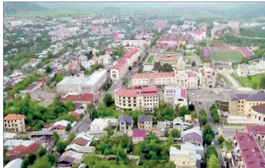
İrəvan da separatçılara qarşıdır...

Arutyunyanı qarşı siyasi müxalifətin çoxalması, dinc insanların ondan tamamilə üz döndərməsi, İrəvanın belə ona arxa çevirməsi separatçıların liderinin onsuz da ağır olan vəziyyətini daha da ağırlaşdırmaqdadır. Xankəndini tərk edən, yaxud müxalifət sırasına keçən hər bir erməni A. Arutyunyanın "liderlik piramidası"ndan düşən daş hesab etmək olar. Hansı ki, bu daşların bir daha yerinə oturmayaacağı gün kimi aydındır.