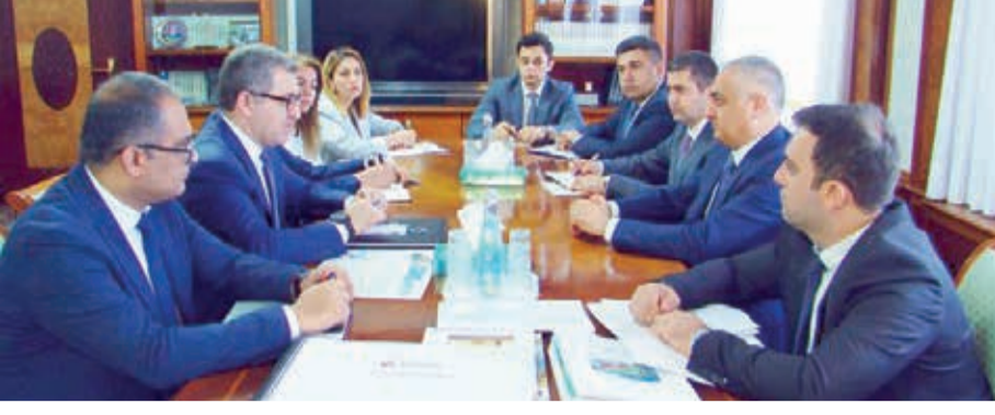
Azərbaycan Respublikası İxracın və İnvestisiyaların Təşviqi Agentliyinin (AZPROMO) nümayəndə heyəti Naxçıvanda səfərdədir.