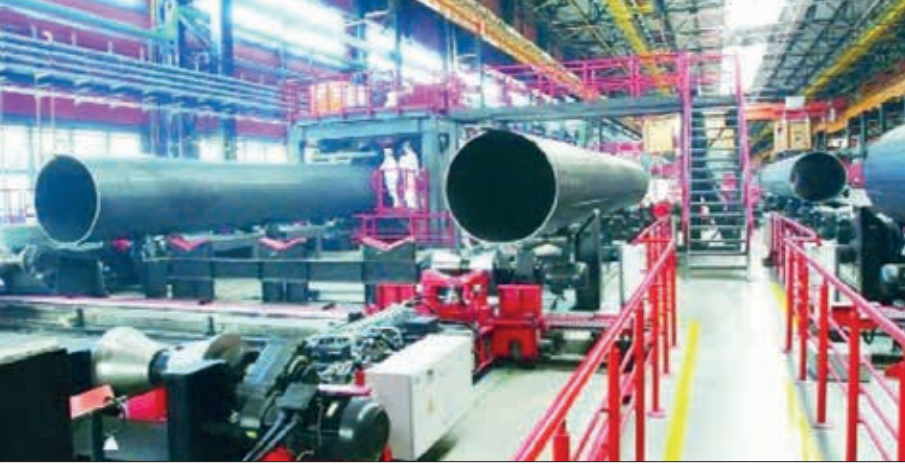
(əvvəli 1-ci səhifədə)

1500-ə yaxın iş adamı Qarabağ və Şərqi Zəngəzurda çalışmaq istəyir