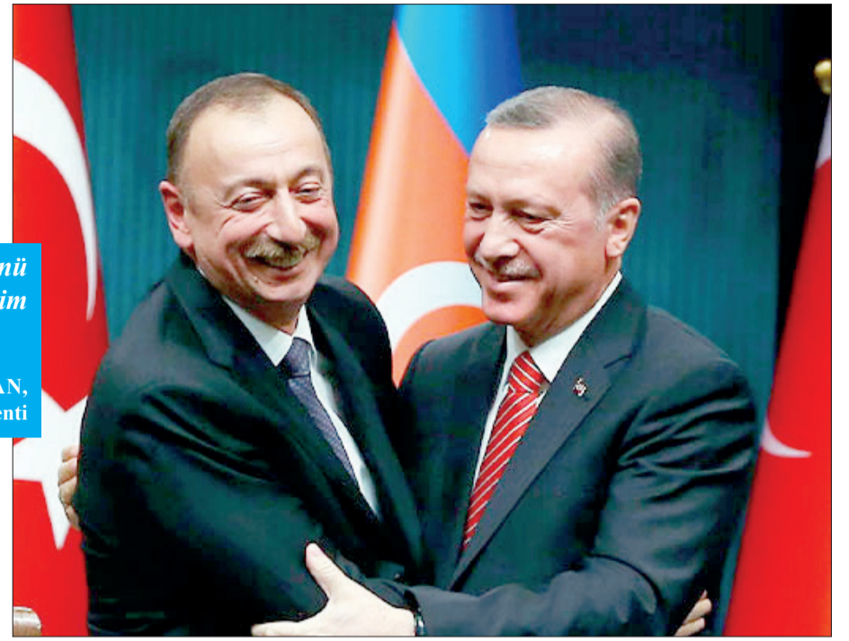
Rəcəb Tayyib ƏRDOĞAN, Türkiyə Cümhuriyyətinin Prezidenti

Prezident Rəcəb Tayyib Ərdoğan isə həmin faktı, yeni rəsmi Ankaranın torpaqlarımızın işğaldan azad edilməsi prosesindəki siyasi-mənəvi iştirakını qardaş ölkədə keçirilmiş son seçkilərin ikinci turundan əvvəlki görüşlərindən birində belə xatırlamışdır: " CHP sədri indi də milliyyətçilik oyunu oynayı. Milliyyətçilik Azərbaycanla çiyin-çiyinə verib Qarabağ 30 illik işğaldan azad etməkdir. CHP Azərbaycanla bağlı fikirlərini ələ qardaş ölkədə səfir olmuş birinin sözləri ilə nümayiş etdirib. İndi həmin adamın Azərbaycanla giriş qadağandır. Bu cür xaini ölkələrinə buraxarlar? Əlbəttə ki, yox. Bundan sonra da azərbaycanlı qardaşlarımızın yanında olacağıq. Türkiyənin şərafinə xələl gəlməsinə əsla icazə vermərik".