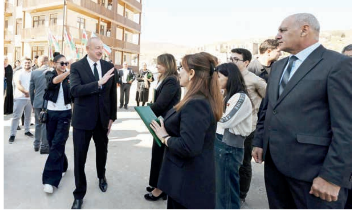
Prezident İlham Əliyevin Cəbrayıl şəhərində inşa olunan yaşayış kompleksinin açılışında cəbrayılılarla görüşü – 4 oktyabr 2024-cü il.

Kiçik Arafqaz dağlarının cənub-şərqində, Naz çayının sol sahilində, İran İslam Respublikası ilə qonşuluqda yerləşən Cəbrayıl rayonunu Ermənistan Silahlı Qüvvələri 1993-cü il avqustun 23-də işğal etmişdi.