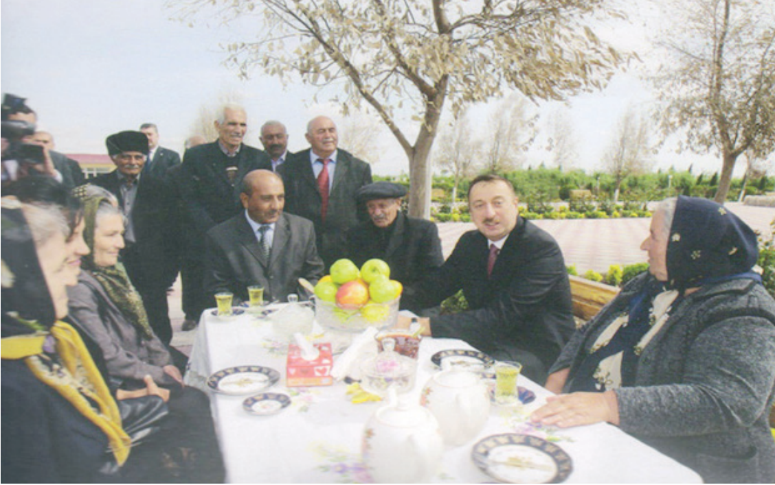
Prezident İlham Əliyevin Biləsuvar rayonunda məskunlaşan cəbrayılı məcburi köçkünlərlə görüşü – 18 aprel 2008-ci il.

Bu, sadəcə, bir vəd deyil, Zəfərli Qayıdışın müjdəsi idi