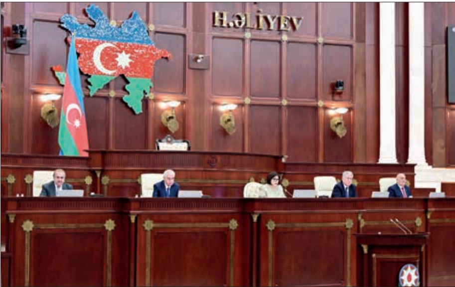
Aprel 1-də Sahib Qafarovun sədrliyi ilə Milli Məclisin yaz sessiyasında növbəti plenar iclası keçirilib.

Milli Məclis sədri əvvəlcə 31 Mart – Azərbaycanlıların Soyqırımı Günü ilə bağlı danışdı. Sonra cari məsələlərlə bağlı müzakirələr aparıldı.