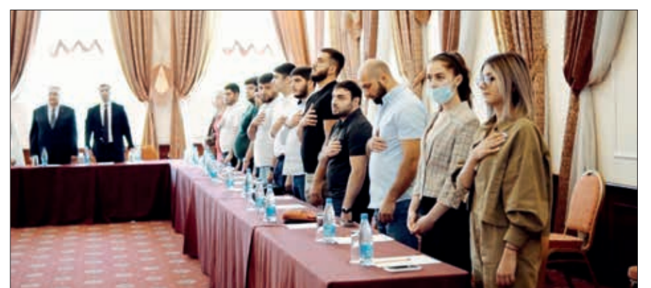
Qırğızstanın paytaxtı Bişkek şəhərində ulu öndər Heydər Əliyevin anadan olmasının 100 illiyinə həsr olunmuş konfrans keçirilib.

Diasporla İş üzrə Dövlət Komitəsinin dəstəyi və "Mərkəzi Asiyada Mütərəqqi Azərbaycanlılar Birliyi"nin təşkilatçılığı ilə baş tutan tədbirdə Qırğızstan Xalqlar Assambleyasının, yerli hökumətin və ictimaiyyətin, türk, qazax, özbək, uyğur, tacik, çəçen diasporlarının nümayəndələri, Qırğızstan və Qazaxıstanda yaşayan soydaşlarımız iştirak ediblər.