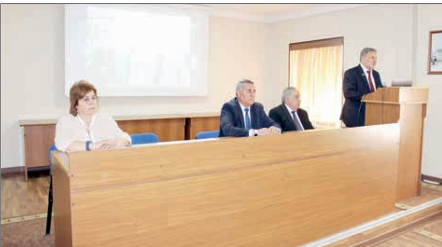
AMEA Naxçıvan Bölməsində "Heydər Əliyevin dövlətçilik siyasəti və müasirlik" mövzusunda elmi konfrans keçirilib.