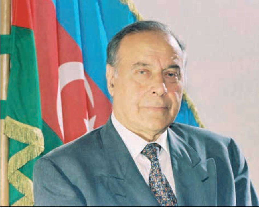
Müasir Azərbaycan dövlətinin memarı, Azərbaycan xalqının ümummilli lideri Heydər Əliyevin adı dövlət quruculuğunun bütün sahələrində həyata keçirilmiş köklü islahatların təşəbbüskarı və təşkilatçısı kimi çağdaş tariximizə qızıl hərflərlə yazılmışdır.

Müstəqilliyimizin ilk illərində dövlətin taleyüklü problemlərinin həlli ilə əlaqədar görülmüş genişmiqyaslı tədbirlər, habelə ölkədə qanunçuluğun möhkəmləndirilməsi ilə yanaşı, cəza siyasətinin humanistləşdirilməsi məsələsinə xüsusi diqqət ayrılması, yeni və müasir hüquq təsisatlarının yaradılması, cəmiyyətdə mərhəmətin zirvəsi kimi qəbul olunan əfv və amnistiya institutlarının yeni məzmununda, yeni humanistlik, insanpərvərlik, ədalət prinsiplərinə əsaslanmaqla tətbiqinə başlanılması və onların daimi xarakter alması, Şərqdə ilk olaraq ölüm cəzasının ləğv edilməsi birmanalı olaraq ümummilli liderin adı ilə bağlıdır.